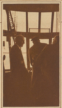
General Nobile als Fahrtteilnehmer im Navigationsraum. Mit welchen Gefühlen mag dieser Mann, der mit einem selbstgebauten kleinen Luftschiff zweimal über den Nordpol flog, heimgekehrt sein?