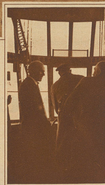
General Nobile als Fahrtteilnehmer im Navigationsraum. Mit welchen Gefühlen mag dieser Mann, der mit einem selbstgebauten kleinen Luftschiff zweimal über den Nordpol flog, heimgekehrt sein?