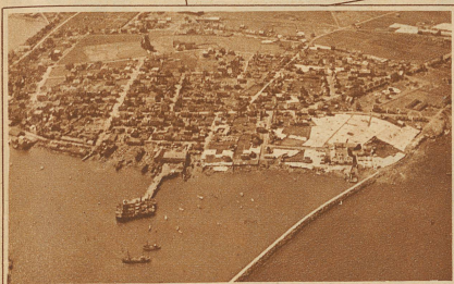
Islands Hauptstadt Reykjavik, deren Bewohner zum erstenmal ein Luftschiff sahen. Die großen weißen Flächen sind Stockfischtrocknereien

Der einsame Laufgang im Innern des Luftschiffes. Diese Zeitaufnahme von mehreren Minuten auf der Fahrt zwischen Norwegen und Island aufgenommen, ist ein Dokument ganz eigener Art