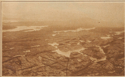
Fjordlandschaft bei Bergen (Norwegen)