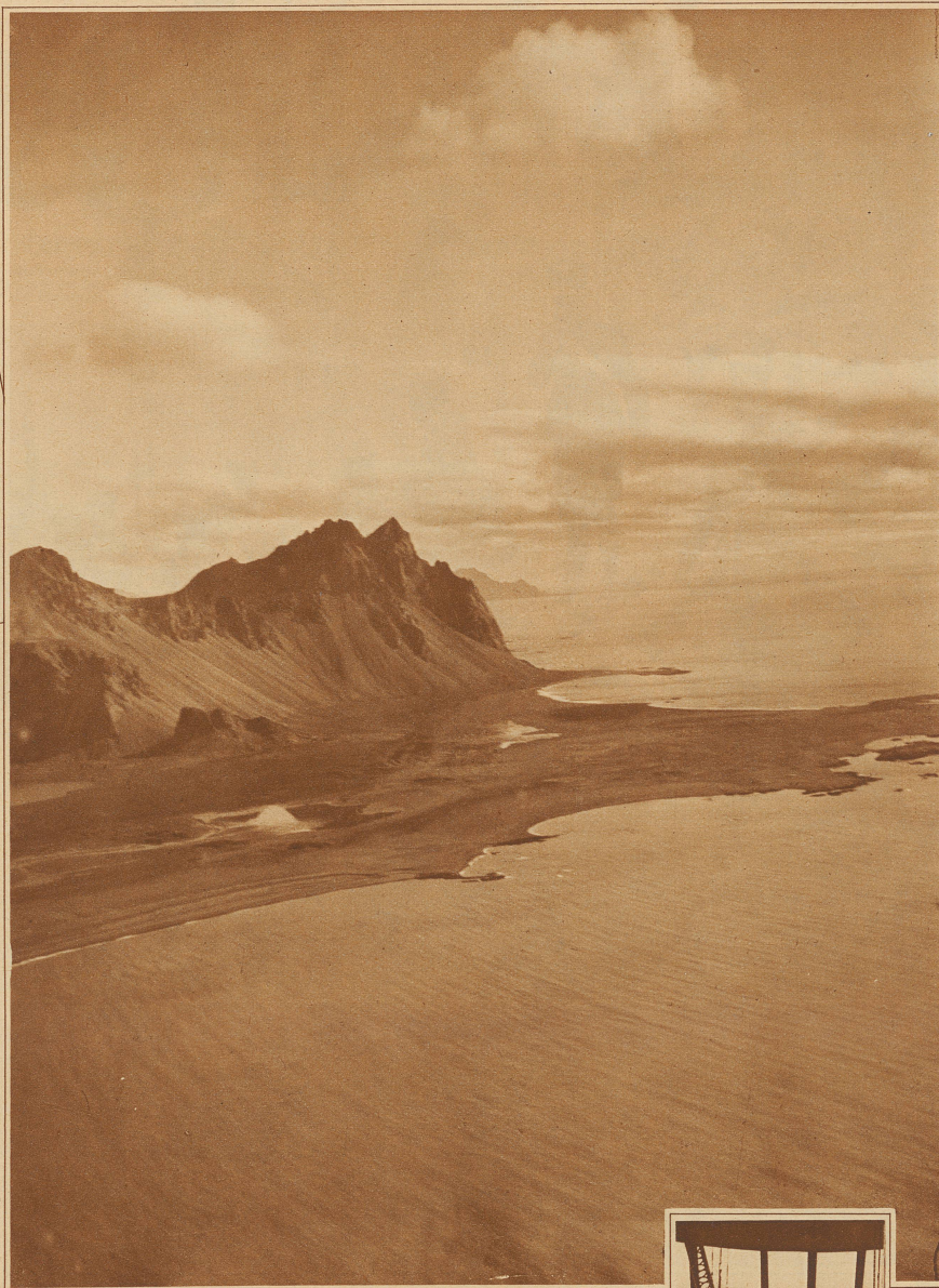
Das Vestrahorn an der Südostküste Islands