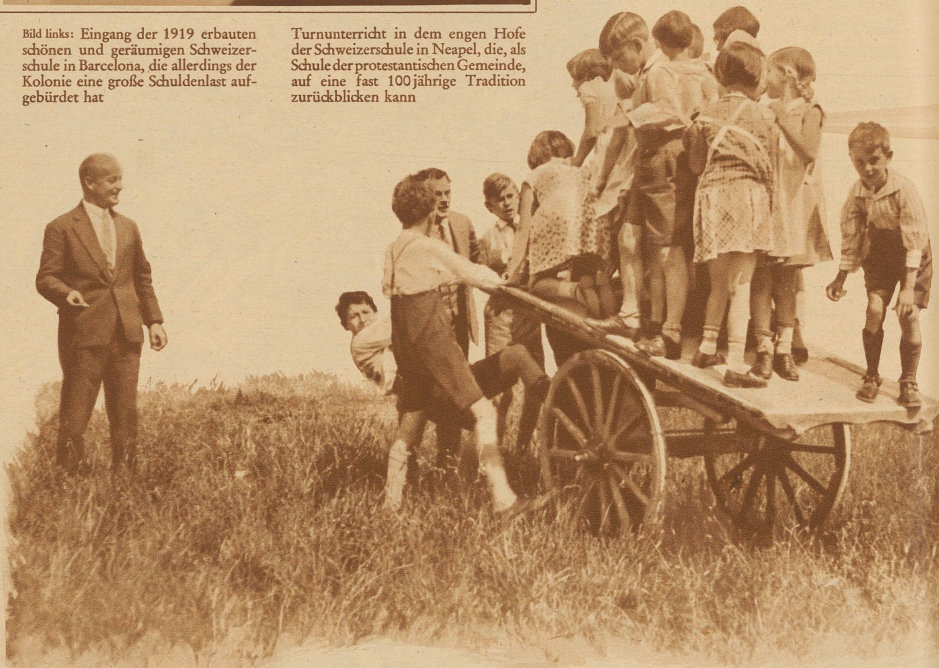
Schüler der Schweizerschule in Ponte San Pietro bei Bergamo belustigen sich in der Pause unter Aufsicht ihrer Lehrer. Die Schule wurde von Glarner Industriellen gegründet und wird vollständig von ihnen erhalten