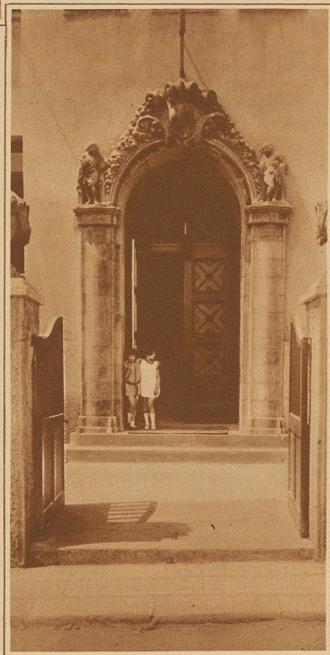
Bild links: Eingang der 1919 erbauten schönen und geräumigen Schweizerschule in Barcelona, die allerdings der Kolonie eine große Schuldenlast aufgebürdet hat

ihre Kinder zu erhalten sucht, sollte des Dankes dieser Heimat wert sein. Die Schweizerschulen, die Schweizerkolonien des Auslandes schauen mit hoffenden Augen nach der Heimat. Möge die Bundesfeier-Sammlung diese Hoffnung erfüllen und ihnen die ersehnte und so notwendige Hilfe bringen. J.