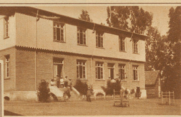
Das neueste, 1919 erbaute Gebäude der großen Schul- und Waisen-Anstalt «Providencia» in Traiguén in Chile, die in den langen Jahren ihres Bestehens Hunderten von Kindern Heim gewesen ist

ihre Kinder zu erhalten sucht, sollte des Dankes dieser Heimat wert sein. Die Schweizerschulen, die Schweizerkolonien des Auslandes schauen mit hoffenden Augen nach der Heimat. Möge die Bundesfeier-Sammlung diese Hoffnung erfüllen und ihnen die ersehnte und so notwendige Hilfe bringen. J.