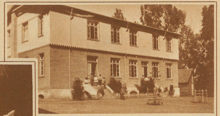
Das neueste, 1919 erbaute Gebäude der großen Schul- und Waisen-Anstalt «Providencia» in Traiguén in Chile, die in den langen Jahren ihres Bestehens Hunderten von Kindern Heim gewesen ist

Wer in der Fremde unter schweren Opfern und oft unter sehr ungünstigen Bedingungen der Heimat