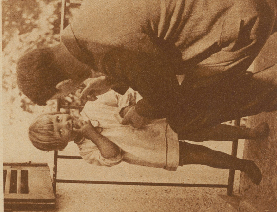
Papa redet mir ernstlich zu, ich müsse immer die genaue Wahrheit reden. Ich hätte gar kein Bauchweh, sagt er. Ob er wohl recht hat?