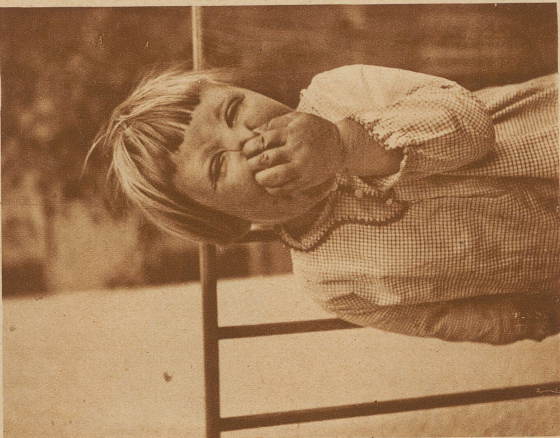
Au!! Käseschnitten — — —