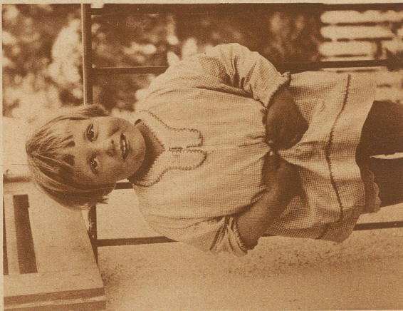
Ich kann nicht essen, — ich habe schrecklich Bauchweh. — — —