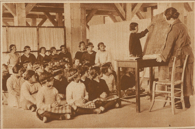
Klasse einer Waisenschule