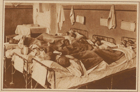
Der Andrang war eine Zeitlang so groß, daß man 3 und 4 Kinder in ein Bett legen mußte