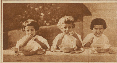
Einige Monate gewissenhafter Pflege gaben den unglücklichen Kindern ihr natürliches, gutes Aussehen zurück

Die Near East Relief Society hatte sich aber in den ersten Jahren nicht nur mit den Kindern zu befassen, sondern sie mußte sich ebenso sehr um die Erwachsenen kümmern, die hilflos das Land durchstreiften. Die Waisenhäuser waren lange Zeit hindurch die einzigen Stellen für den Postverkehr und für