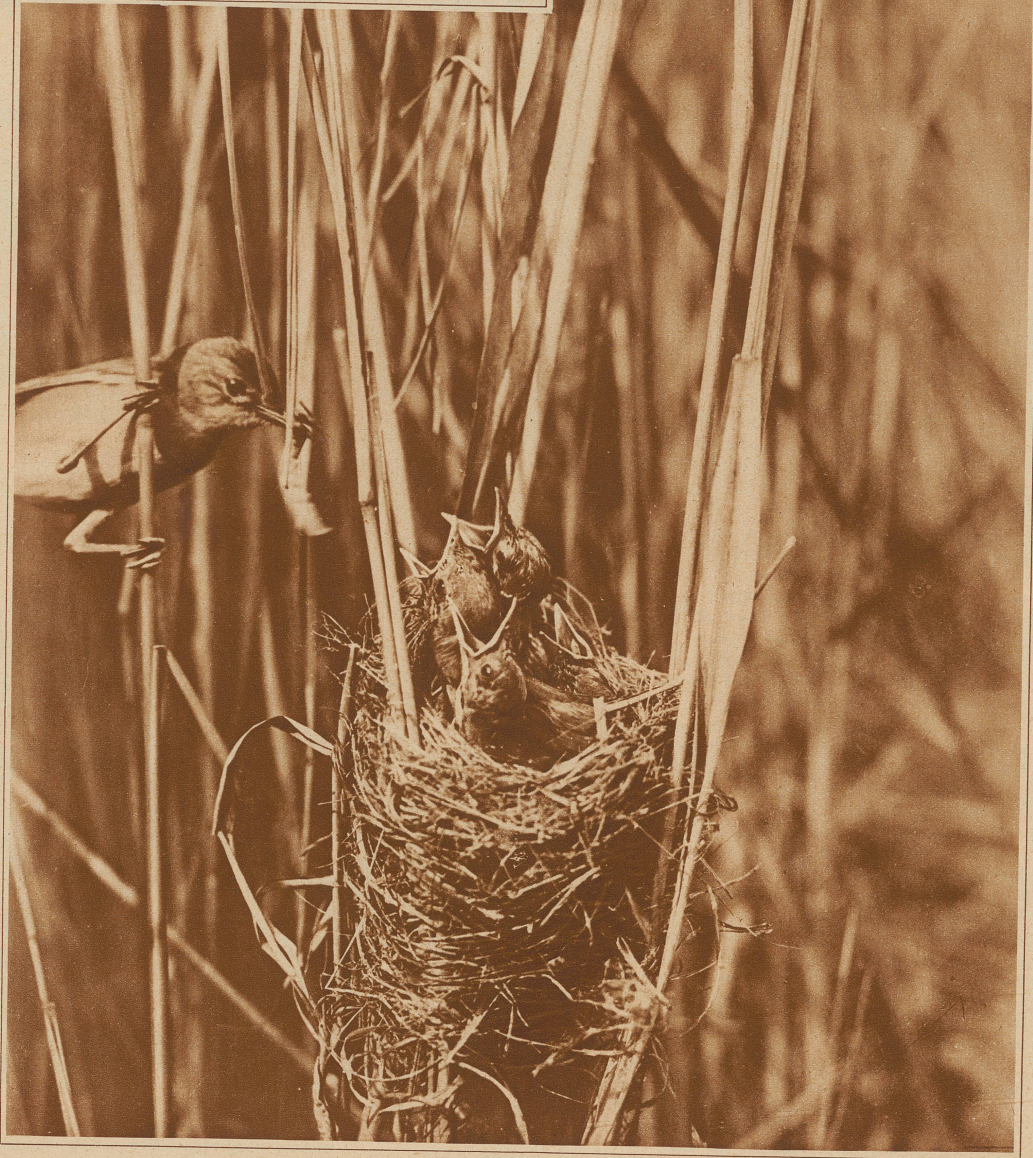
4 kleine Rohrsänger, die glücklicherweise keine Waisenkinder sind

Heute ist das Schlimmste überstanden. Die Gesellschaft kann sich ausschließlich ihren 132,000 Kindern widmen, die ihre Waisenhäuser bevölkern. Sie werden gepflegt, erzogen und zu Berufen herangebildet, die für die Bewohner der älteren Generation keine direkte Konkurrenz bedeuten. Wissenschaftlich ausgebildete Bauern, Dorfschullehrer, Mechaniker, Elektriker, Maurer, Dactylographinnen, Kindergärtnerinnen, Chauffeure usw. sind einige dieser Berufe, die schon an sich geeignet sind, das wirtschaftliche Niveau des Landes zu heben, neuen Bedarf, neue Produktionsmöglichkeiten zu schaffen und auf diese Weise zur Besserung der allgemeinen Lage der Gesamtbevölkerung beizutragen.