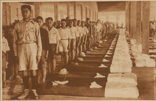
Schlafsaal in einem Heim in Syra, einer Insel im Ägäischen Meer

Es gab einen Augenblick, wo das heutige Griechenland mit seinen 5 Millionen Einwohnern elend und erschöpft darniederlag, und in dieser denkbar