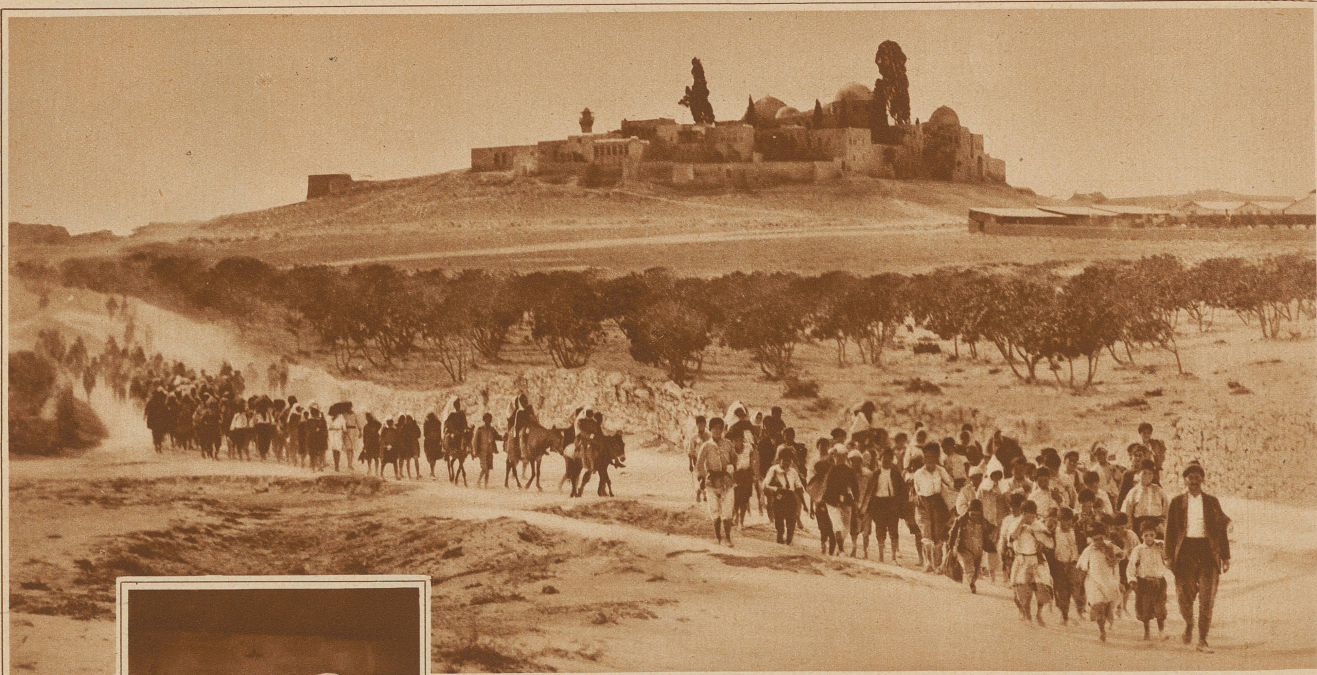
Auf der Suche nach einer neuen Heimat. In den Jahren 1922–23 wurden 23 000 armenische und griechische Waisenkinder aus der Türkei nach Griechenland und Syrien gebracht. Viele mußten den weiten und beschwerlichen Weg unter großen Entbehrungen zu Fuß zurücklegen