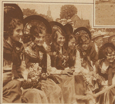
Die schmucken Thurgauerinnen scheinen an den stämmigen Schwingern Gefallen zu finden