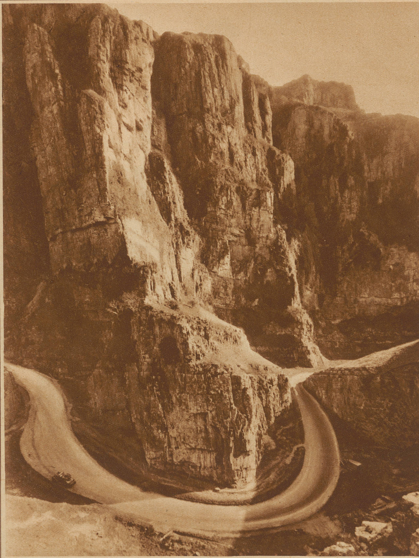
Die düstere und leidenschaftliche Straße in der Cheddar-Schlucht in England. Sie läuft in einem alten Flußbett, dessen Wasser sich in dem klutreichen Kalkgebirge seit langem einen unterirdischen Abfluß gesucht hat