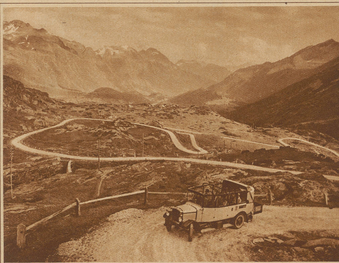
Die großzügige Straße des San Bernardino. In weiten Schwingen legt sie sich über die Landschaft. «Platz da!» sagt sie, «ich habe viel vor und weiß wohin ich will!»