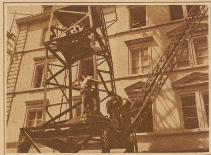
Die Füße des aufgestellten Eisenkranes werden am Eisengestell festgemacht

glücklich auf vier Füßen steht, schlüpft er wieder in sein Häuschen. Nicht aber, bevor die Füße des Kranes auf dem Eisengestell festgemacht sind. Dann kommt der Bauherr und ist froh, wenn der Kran endlich seine Arbeit beginnen kann.