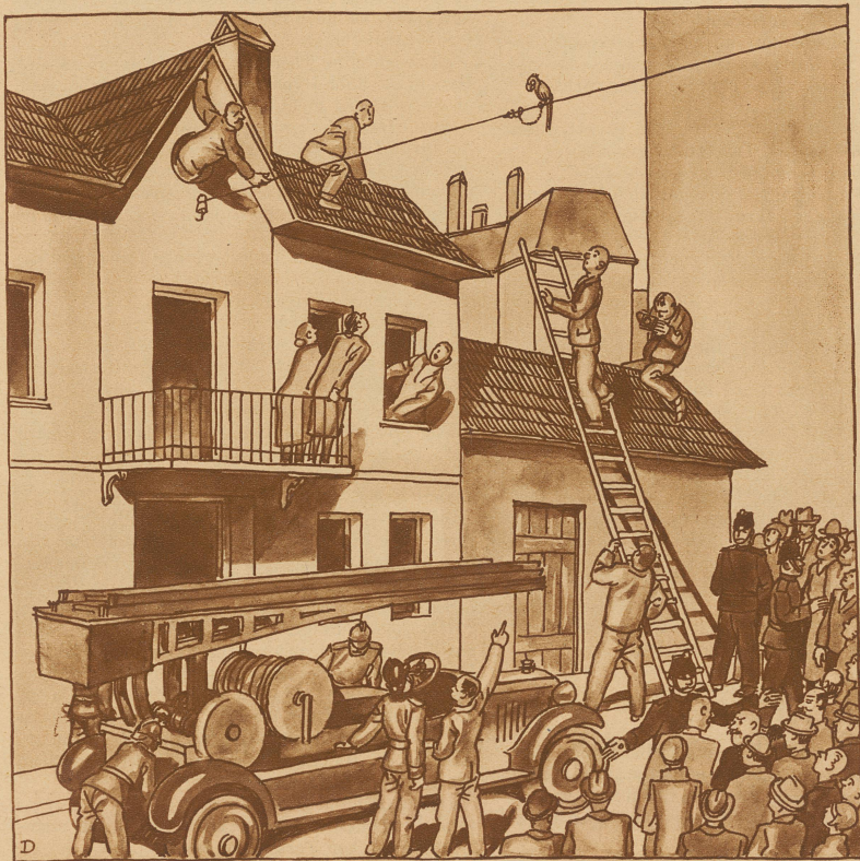
Der entlogene Papagei