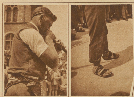
Die obere und die untere Hälfte eines Alphornbläfers