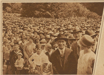
Kopf an Kopf drängt sich die Zuschauermenge beim Alphornblasen auf dem Platzspitz.