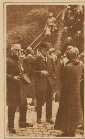
Bundespräsident Musy nach dem Gottesdienst in der Liebfrauenkirche