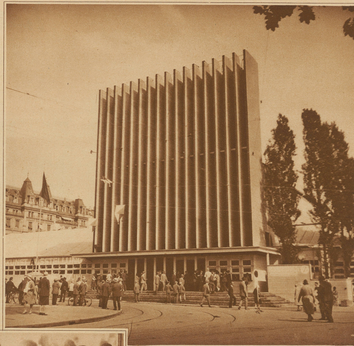
Der Haupteingang der «Zika»