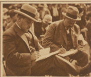
Das strenge Preisgericht