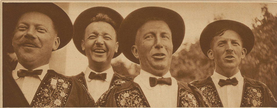
Luegit, vo Bäs ärg und Tal...