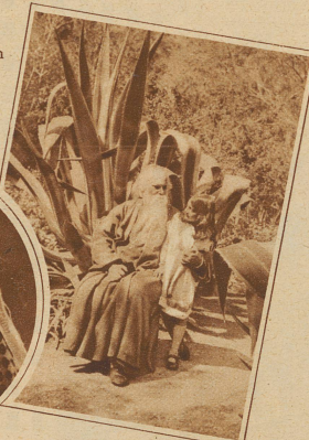
Bild links: Der indische Dichter Rabindranath Tagore mit seiner Enkelin Nandini

Bild rechts: Viehaustellung in Madrid. König Alfons von Spanien (X) betrachtet mit unverhohlener Bewunderung ein Schwein aus Estremadura