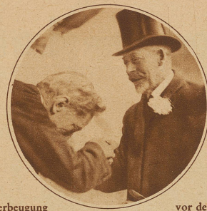
Die Verbeugung vor dem König. Der Direktor des Haymarket Theaters empfängt den englischen König bei seiner Ankunft im Theater, wo er einer Aufführung des «Hamlet» bewohnt.

Die Steinwand eines modernen Großstadteingebäudes vom Hof aus gesehen (Phot. Drerup)