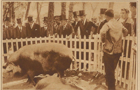
Bild rechts: Viehaustellung in Madrid. König Alfons von Spanien (X) betrachtet mit unverhohlener Bewunderung ein Schwein aus Estremadura

Bild links: Der indische Dichter Rabindranath Tagore mit seiner Enkelin Nandini