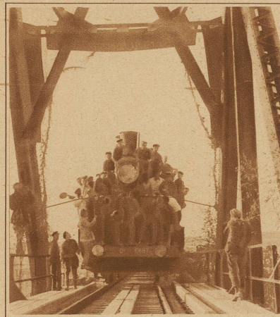
Der Eröffnungszug der russischen Turksib-Eisenbahn, deren Vollendung dieser Tage gefeiert wurde. Sie führt von Turkestan nach Sibirien und ist etwa 1500 km lang, was der vierfachen Strecke Romanshorn-Genf entspricht.