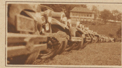
Ein kleiner Seitenblick auf die Autokolonnen auf dem Rennplatz