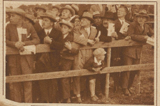
Trotzdem sie nicht gewettet haben, verfolgen sie doch mit großer Spannung den Verlauf der Rennen