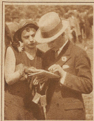
Die interessante Stirnlocke