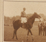
Burgers «Prevoiant», Sieger im Preis der Manège