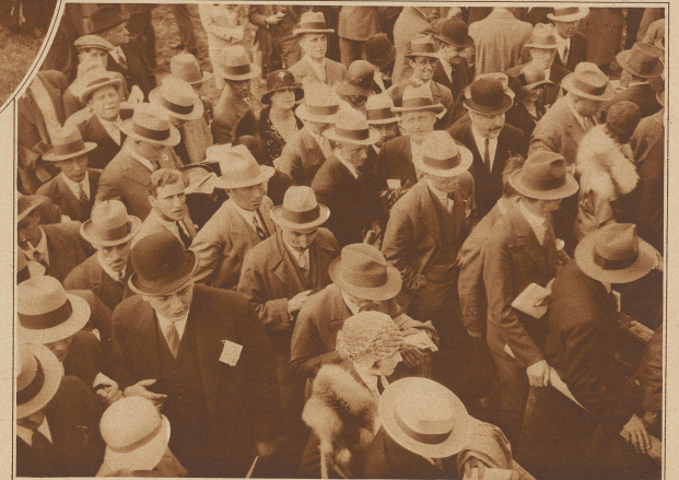
Rechts nebeneinander: Die glücklichen Gewinner warten vor den Schaltern des Totalisators auf die Auszahlungen, die bekanntlich meistens hinter den Erwartungen und Hoffnungen zurückbleiben