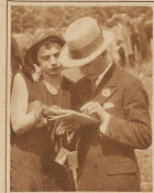
Die interessante Stirnlocke