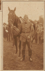
Militär-Campagne-Reiten der Kavalleristen um den Preis vom Sihlfeld