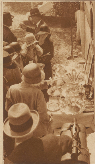
Der Gabentisch mit den Ehrenpreisen