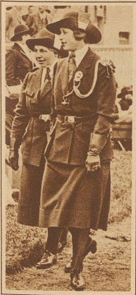
Prinzessin Mary, die englische Königs-tochter, in ihrer Uniform als Pfadfinder-Führerin