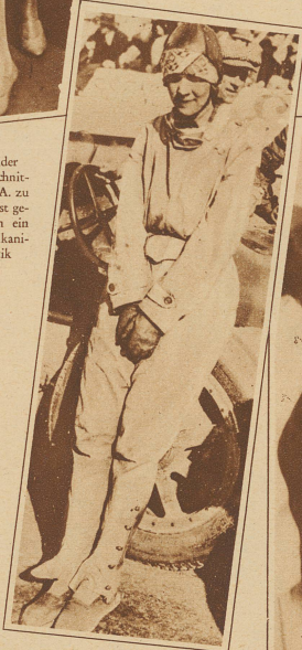
Baronin d'Elen, die bekannteste Automobil-Rennfahrerin Frankreichs, fuhr beim Rennen um den großen Preis von Algerien gegen einen Kilometerstein und blieb tot am Platze