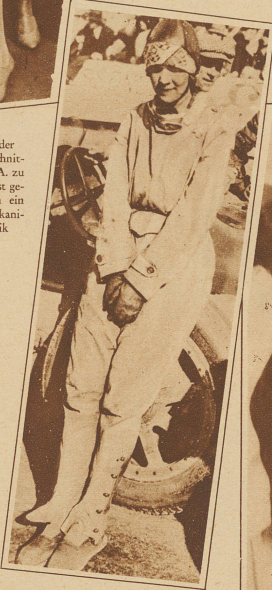
Baronin d'Etern, die bekannteste Automobil-Rennfahrerin Frankreichs, fuhr beim Rennen um den großen Preis von Algerien gegen einen Kilometerstein und blieb tot am Platze