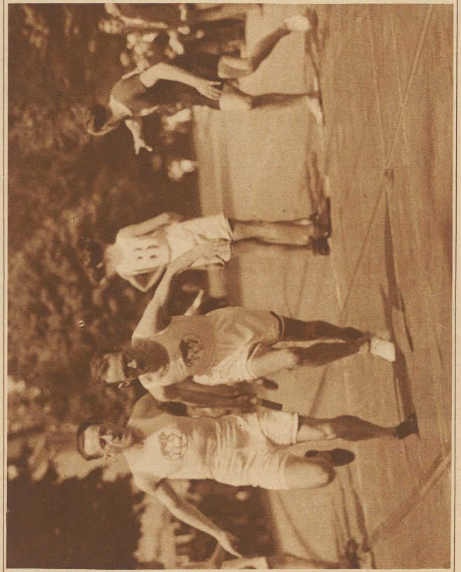
Ein Stabwechsel der I. Mannschaft des F. C. Zürich in Kategorie A