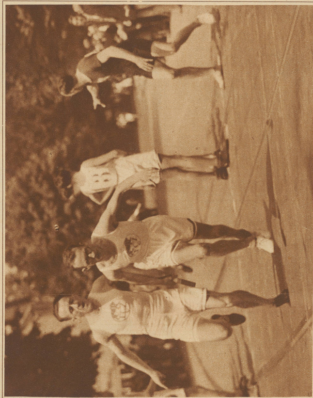
Ein Stabwechsel der I. Mannschaft des F. C. Zürich in Kategorie A

Die Schlüsselübergabe durch den Präsidenten des Städtischen Rats an den Zentralschützen des F. T. V. Scheuermann