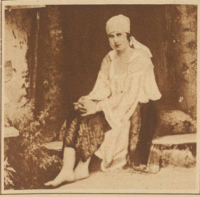
Prinzessin Ileana von Rumänien, berühmt wegen ihrer Schönheit, ist vorübergehend des modernen Komforts müde und zeigt sich hier barfuß als Bewohnerin einer ärmlichen Hütte