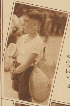
Wo eine Brücke ist, da ist auch Wasser. Die Zürcher Knaben mögen nicht warten, bis sie unter der Brücke durchschwimmen dürfen