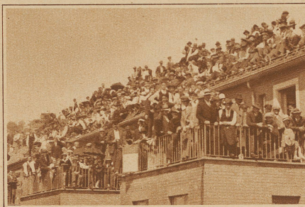
Das rentable Hausdach: Billige Bestuhlung, hohe Preise