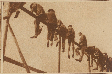
Zaungäste verschiedensten Alters. Nur für Leute ohne Schwindel und mit guten Augen