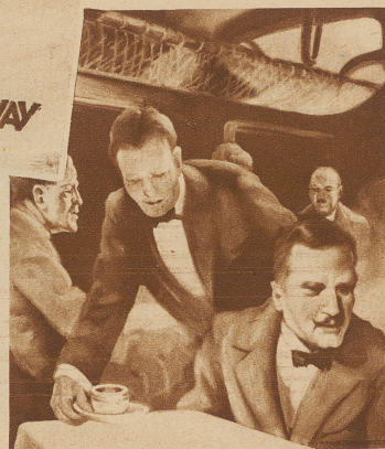
Unteres Bild: Der Kellner erkundigt sich nach den Wünschen

in die tosende Weltstadt zu gelangen. Wir aber, die wir zwei Stunden später mit dem Nacht-Express weiter wollen, setzen uns in die behaglichen Gasträume des Flughafens und schauen uns etwas um, unterhalten uns über all die vielen Eindrücke, die unsere erste Flugetappe Zürich-Berlin hervorgerufen hatte. — «Die Fluggäste Nacht-Express Berlin-Königsberg-Moskau, bitte zur Sperre» — — tönt es wieder aus dem Lautsprecher, der von einem turmartigen Häuschen aus, durch einen leitenden Beamten besprochen wird. Gemächlich brechen wir auf. Wir stehen vor unserer Maschine, deren Motore einzeln noch überprüft werden. Erst langsam, dann immer schneller peitschen die Propeller die Luft. In dem eigenartigen Zwielflicht der Dämmerung und der strahlenden Scheinwerfer hört sich das Gebrüll der Motoren