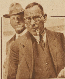
Der kritische Besucher