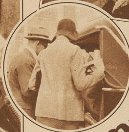
Bild im Kreis: Die Messe tut ihren Dienst: Sie macht die Gattin auf ein Schweizer Auto glustig