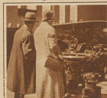
Gattin und Gatte in seelischer Uebereinstimmung vor den Werken der Technik