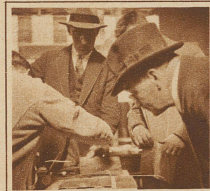
Der genaue Besucher