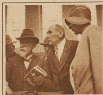
Der erstaunte Besucher