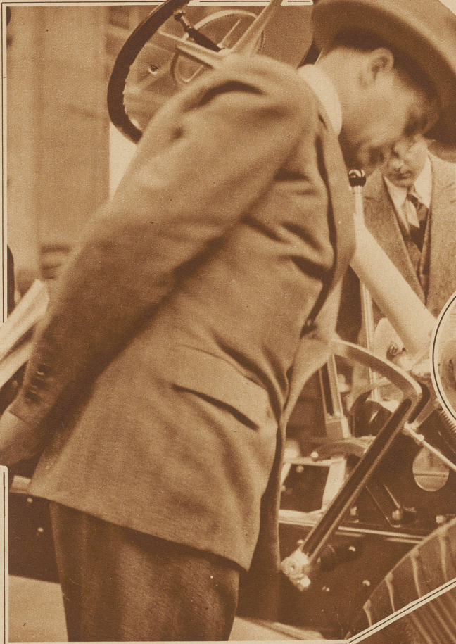
Bild links: Der Besucher wie er sein soll: sehr vertieft, ernsthaft über einen Ausstellungsgegenstand gebeugt und mit dem Messekatalog versehen