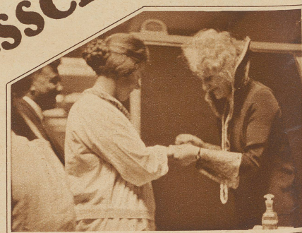
Nebenstehend rechts: Die Mustermesse verschönt ihre Gäste: die meisten kommen mit polierten Nägeln nach Hause