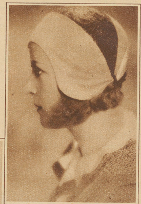
Kleidsamer kleiner Strohhut in braun und beige

wenn vielleicht auch Frauen mehr als früher hinter ihm her sind. Aber da die Frau ihm ins öffentliche Leben nachfolgte, ließ sie auch das Wahrzeichen besorgter Häuslichkeit daheim. Sie legte die Schürze ab. Wenn Schürzen für den Mann das Interesse verloren haben, ja wenn er sie scheinbar gering achtet, soll die Frau ihn dann in der Schürze empfangen? Selbst den Arbeitsmantel, der am Vormittag ihrer Tätigkeit beruflichen Anstrich gibt, legt die Hausfrau ab und präsentiert sich dem Herrn Gemahl im schmucken Kleid. Ob er aber wirklich weniger nett wäre, wenn in gefälliger moderner Form ein Schürzengebilde das frauliche Kleid davor bewahrte, mit Suppenspritzern und Saucen in Berührung zu kommen, das käme erst noch auf die Probe an. — Man sage nicht, daß die Schürze mit der Mode nichts zu tun habe. Auch Schürzenlosigkeit ist Modesache, wenn auch negativer Art. Vielleicht kommen aber die Schürzen bald wieder. Bereits schlingen wir auf hübschen Kleidern Fichu-