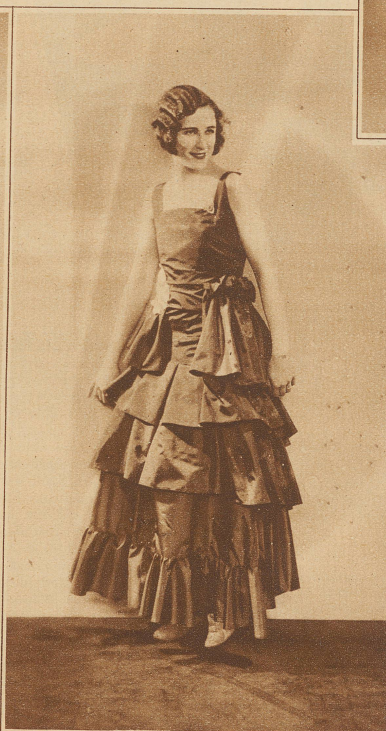
Die nächste Generation wird spotten: Als der Großvater die Großmutter nahm

aus nichts Neues. Wer kennt nicht die berühmte «Chocoladière», die im Louvre hängt! Bonnards «Dame mit Schürze» ist jedem Kunst- und Modehistoriker bekannt, und er weiß, daß diese Schürze nichts anderes war, als ein breites Spitzenvolant. Volants aber, du lieber Himmel, die traversieren in Hülle und Fülle unsere neuen Kleider in Brust-, Taillen-, Hüft- und sonstiger Schürzenhöhe.