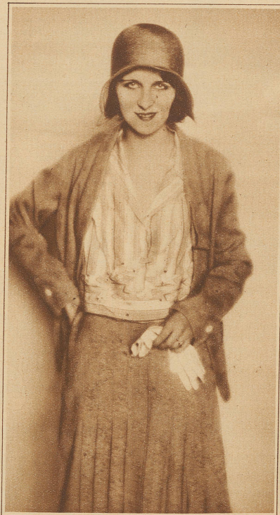
Die neue kurze Bluse

wenn vielleicht auch Frauen mehr als früher hinter ihm her sind. Aber da die Frau ihm ins öffentliche Leben nachfolgte, ließ sie auch das Wahrzeichen besorgter Häuslichkeit daheim. Sie legte die Schürze ab. Wenn Schürzen für den Mann das Interesse verloren haben, ja wenn er sie scheinbar gering achtet, soll die Frau ihn dann in der Schürze empfangen? Selbst den Arbeitsmantel, der am Vormittag ihrer Tätigkeit beruflichen Anstrich gibt, legt die Hausfrau ab und präsentiert sich dem Herrn Gemahl im schmucken Kleid. Ob er aber wirklich weniger nett wäre, wenn in gefälliger moderner Form ein Schürzengebilde das frauliche Kleid davor bewahrte, mit Suppenspritzern und Saucen in Berührung zu kommen, das käme erst noch auf die Probe an. — Man sage nicht, daß die Schürze mit der Mode nichts zu tun habe. Auch Schürzenlosigkeit ist Modesache, wenn auch negativer Art. Vielleicht kommen aber die Schürzen bald wieder. Bereits schlingen wir auf hübschen Kleidern Fichu-