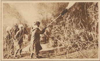
Flammenwerfer haben sich als das wirksamste Mittel gegen die Heuschreckenplage erwiesen. Dabei werden allerdings auch die Bäume und Sträucher verbrannt

«Sonne und Mond werden finster von ihnen und die Sterne verhalten ihren Schein», hat schon der Prophet Joel ausgerufen. Aber nicht erst seit biblischer Zeit sind die schrecklichen Invasionen dieser gefräßigen Tiere gefürchtet: Schon vor fünf Jahrtausenden sammelten sie sich von Zeit zu Zeit in den weiten Steppen des Hauran im südlichen Syrien. Von da aus suchten sie all die Jahrtausende hindurch Transjordanien und Palästina heim und gelangten nicht selten bis nach Ägypten, mit ihrem unersättlichen Hunger alles vernichtend, was am Wege stand. Aus neuester Zeit ist noch die große Plage in Erinnerung, die im Jahre 1915 über Palästina hereinbrach. In wenigen Augenblicken verzehrten die Milliarden und Abermilliarden Heuschrecken die ganze Ernte. Alles Grün war verschwunden, kahl ragten die Äste der Bäume gen Himmel. Es kam sogar vor, daß die Eisenbahnzüge auf offener Strecke stehen blieben, weil Schienen und Räder von den zerquetschten Tieren jede Adhäsion verloren hatten. — Nun bedroht eine neue große Invasion Ägypten, und zwar gleich von zwei Seiten, nämlich aus Abessinien, wo sich gewaltige Schwärme sammeln, und aus dem Osten. Mehrere Schwärme haben schon den Suezkanal über-