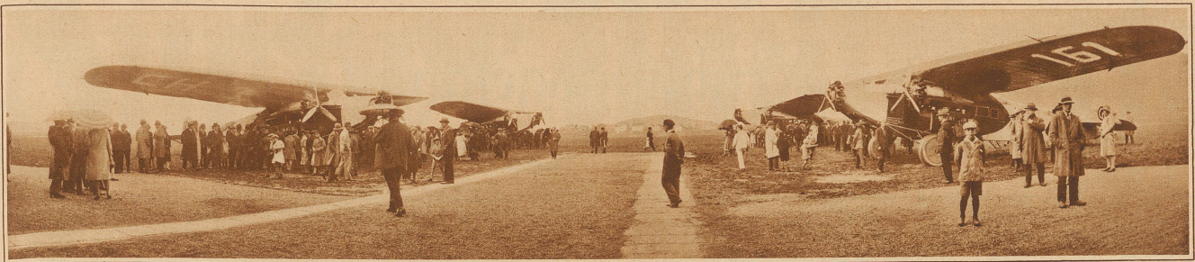
Flugzeugtaufe der Balair. Gleich vier neue dreimotorige Fokkerflugzeuge hat die um den schweizerischen Luftverkehr verdiente Balair letzten Samstag auf dem Basler Flugplatz aus der Taufe gehoben. «Jungfrau», «Piz Palü», «Monte Rosa» und «Mont Blanc» sind ihre Namen. Mögen sie in der Hand der bewährten Piloten allzeit sicher und heil von ihren Fahrten heimkehren. Das Bild zeigt die vier Maschinen vor Beginn des Taufaktes