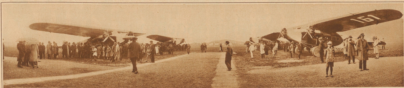
Flugzeugtaufe der Balair. Gleich vier neue dreimotorige Fokkerflugzeuge hat die um den schweizerischen Luftverkehr verdiente Balair letzten Samstag auf dem Basler Flugplatz aus der Taufe gehoben. «Jungfrau», «Piz Palü», «Monte Rosa» und «Mont Blanc» sind ihre Namen. Mögen sie in der Hand der bewährten Piloten allzeit sicher und heil von ihren Fahrten heimkehren. Das Bild zeigt die vier Maschinen vor Beginn des Taufaktes