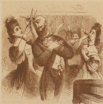
— — — und nach dem Konzert

welche die Pferde vom Wagen des Künstlers ausspannte, sich dann selbst vor das Gefährt stellte und die Geliebte oder den Geliebten durch die ganze Stadt zog. Allerdings wäre eine ähnliche Tat heute mit größern Schwierigkeiten verbunden, denn welcher große Künstler fährt heute mit einem, statt mit mindestens 15 PS?