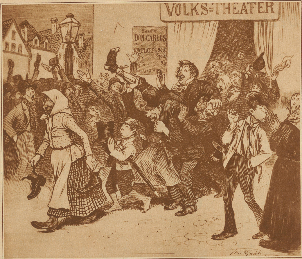
Der Liebling des Vorstadttheater-Publikums. Da sie ihm die Pferde nicht ausspannen können, ziehen sie ihm die - Schuhe aus und tragen ihn in die Wohnung Karikatur aus dem Jahre 1882