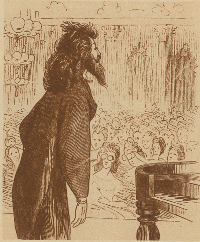
EINST: der Künstler vor dem Konzert — — —

Man muß lächeln, wenn man an die Begeisterungsvibrationen der früheren Jugend denkt,