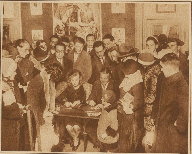
LILIAN HARVEY und W. FRITSCH teilen in Zürich Autogramme aus

hinter einem Berg von Photographien, die er alle mit seiner Unterschrift versehen soll