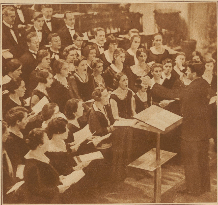
Der Häusermannsche Privatchor aus Zürich bei einem kürzlich in der Hochschule für Musik in Berlin mit großem Erfolg gegebenen Konzert