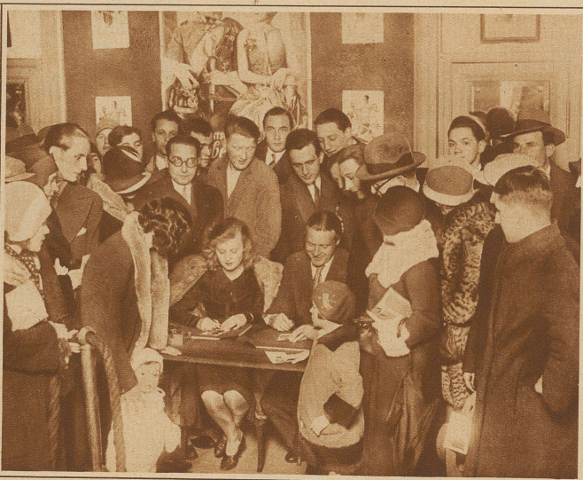
LILIAN HARVEY und W. FRITSCH teilen in Zürich Autogramme aus

hinter einem Berg von Photographien, die er alle mit seiner Unterschrift versehen soll