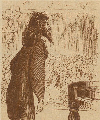
EINST: der Künstler vor dem Konzert — — —

Man muß lächeln, wenn man an die Begeisterungsvorgänge der früheren Jugend denkt,