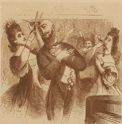
— — — und nach dem Konzert

welche die Pferde vom Wagen des Künstlers ausspannte, sich dann selbst vor das Gefährt stellte und die Geliebte oder den Geliebten durch die ganze Stadt zog. Allerdings wäre eine ähnliche Tat heute mit größern Schwierigkeiten verbunden, denn welcher große Künstler fährt heute mit einem, statt mit mindestens 15 PS?