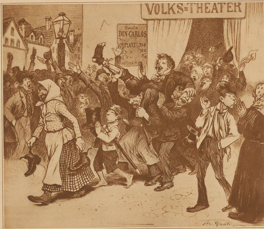
Der Liebling des Vorstadttheater-Publikums. Da sie ihm die Pferde nicht ausspannen können, ziehen sie ihm die - Schuhe aus und tragen ihn in die Wohnung Karikatur aus dem Jahre 1882