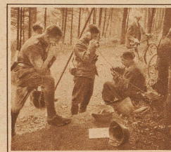
Hallo! Hier Landwehreg. 49. Eine Feld- telephonstation bei Blau