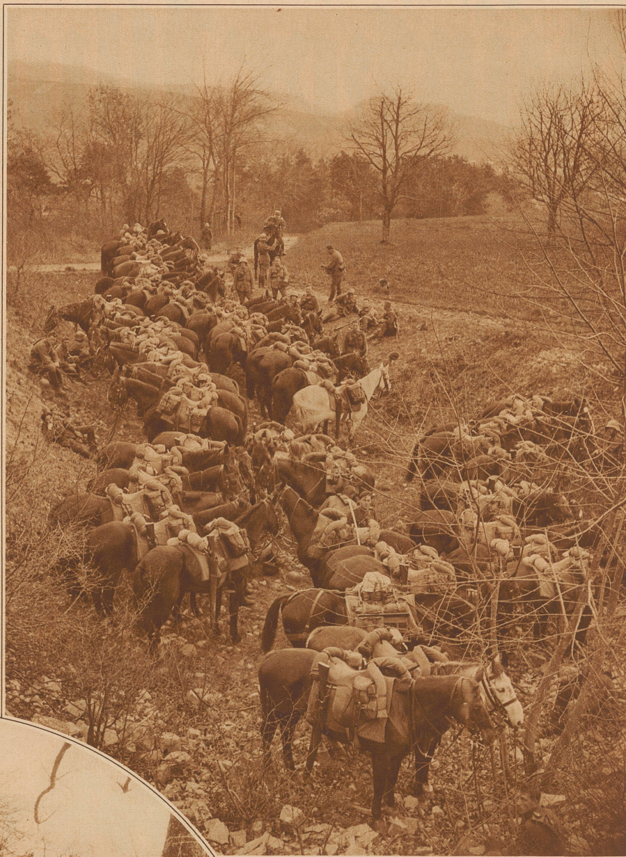
Die Pferde der abgesessenen Schwadron 28 in einer Mulde