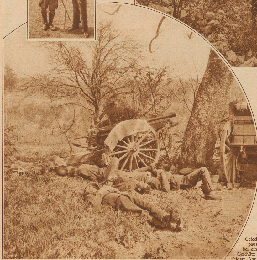
Gefechts- pause bei einem Geschütz der Feldart. Abt. 14