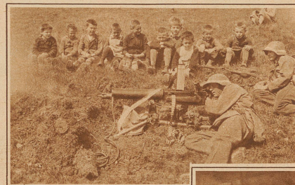
Sie alle wollen auch einmal Mitrailleure werden