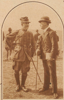
Oberstkorps- kommandant BRIDLER im Gespräch mit dem deutschen Reichswehrgeneral Reinhard, der in Zivil den Manövern folgte