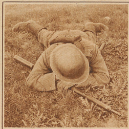
Lieb Vater- land magst ruhig sein...