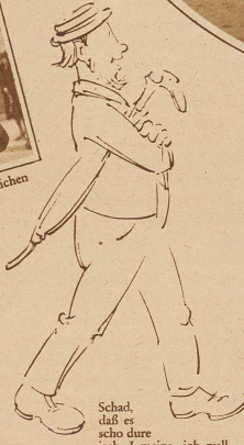
Schad, daß es scho dure isch. I meine, ich well nochli hinder der Musik härmarschiere

«Sie, do vorne, chöntet Sie nid wenigstes de Huet abtue. Die hindere gsehnd ja nit. Sie! Ghored Sie nit?!» «Wäge-me Bögg tuen ich de Huet nid ab», hät de Gigertheiri gseit.