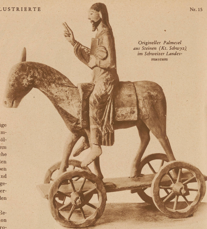
Origineller Palmesel aus Steinen (Kt. Schwyz), im Schweizer Landes- museum

Im Jahre 1522 wurde der Zürcher Palmesel in