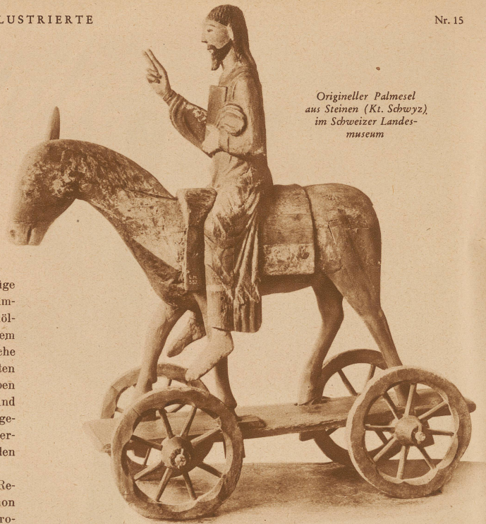
Origineller Palmesel aus Steinen (Kt. Schwyz), im Schweizer Landes- museum