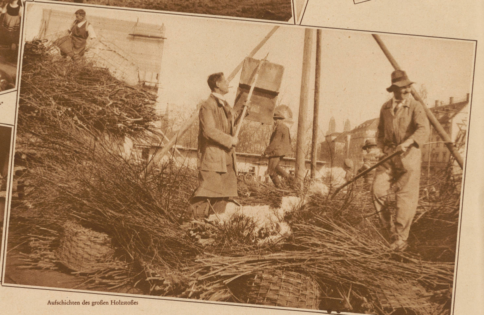
Aufsichten des großen Holzstoßes