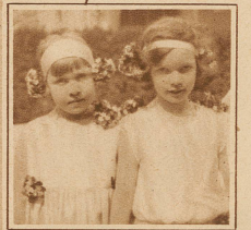
Kinder des Frühlings