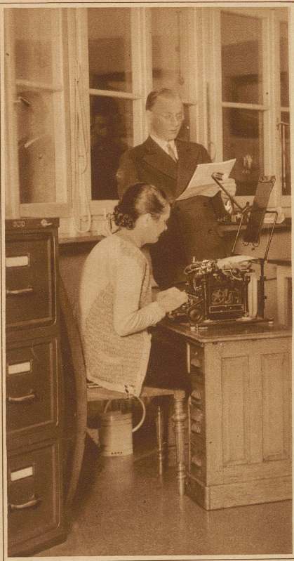
«Schreiben Sie: ...»