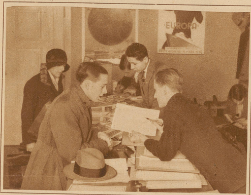
Hochbetrieb im Reisebüro «Tempo-Tempo»

Aber der Dieb kommt nicht auf seine Rechnung, denn er findet im Geldschrank nur ... Scheingeld!