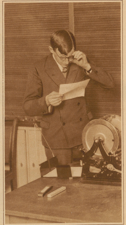
Die «Swiss Capitol Bank» in Zürich druckt ihre Kurszettel selbst

Nullen abstreicht, wenn die Bilanzen astronomischen Zahlen zustreben wollen, der eingreift, sobald überhaupt der Geschäftsgang den Boden der Möglichkeit zu verlassen droht. Die einzelnen Institute holen sich ihre Debitoren und Kreditoren, ihre finanziellen Transaktionen und Warenverkäufe, ihre Offertenempfänger und Reisendenopfer nicht irgendwo aus dem Phantasieland, sondern sie stehen mit ihren Scheinfirmenschwestern in richtigem Verkehr, in einer praxisgetreuen Korrespondenz, die die Sach- und Geldgeschäfte ordnet. Der Verkehr geht auch