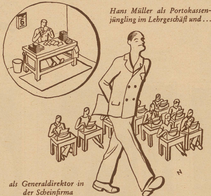
als Generaldirektor in der Scheinfirma