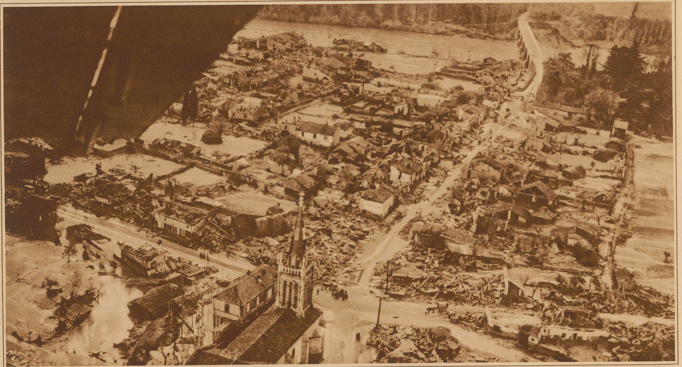
Flugzeugaufnahme eines durch die Ueberschwemmungskatastrophe in Südfrankreich zerstörten Dorfes