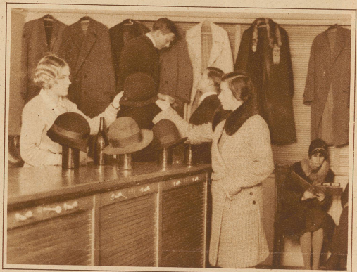
In den Magazinen Fabelhaft und Billig: «... aber ich würde Ihnen doch dieses Pariser-Modell empfehlen, es steht Ihrem Gesicht ganz besonders gut»