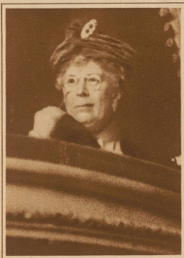
Anfänglich noch reserviert

4 Aufnahmen der Königin von England während einer Wohltätigkeitsvorstellung in London