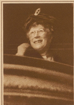
Zum Schluß ist sie ganz und gar bei der Sache