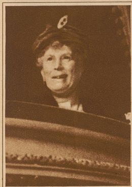
Ein Lächeln huscht über ihr Gesicht