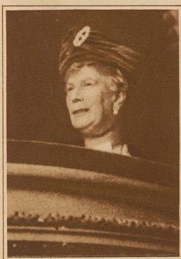
Das Interesse erwacht