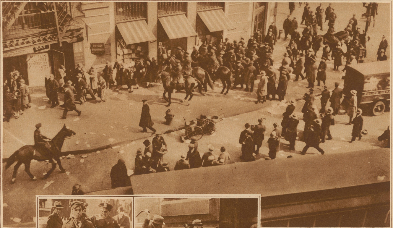
Berittene Polizei vertreibt Demonstranten

Der erste Ozeanbezwinger im Flugzeug, Oberst Charles Lindbergh, macht in Kalifornien Versuche mit einem neuen motorlosen Flugzeug. Der Apparat ist elegant konstruiert und gleicht im Fluge einer Libelle