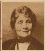
Mrs. Pankhurst, die mutige Vorkämpferin für das Frauenstimmrecht in England