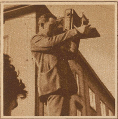
Bild links: «Anderer Leute Vergnügen macht uns Arbeit», sagt der Photograph