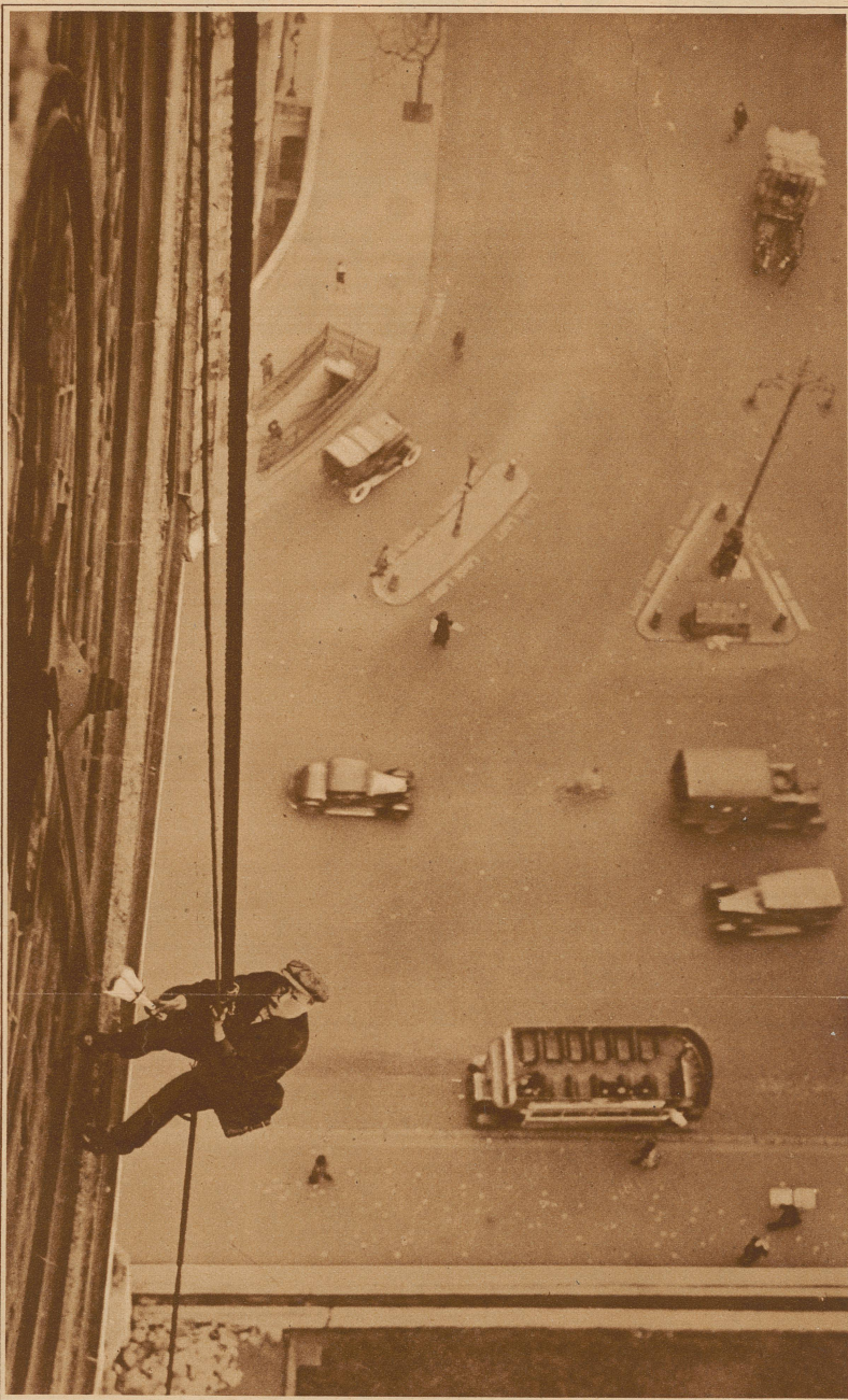
Zwischen Himmel und Erde. Reinigen der Turmuhr am »Big Ben«, dem berühmten Glockenturm des Londoner Parlamentsgebäudes. Das Gefälle des »Big Ben« ist wohl den meisten Radiohörern bekannt, wird es doch jede Silvesternacht in alle Welt übertragen