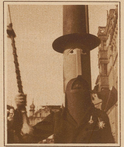
Großkopfeter Basler Tambourmajor