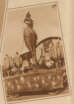
Prinz Karneval und seine Krokuskinder in Chur