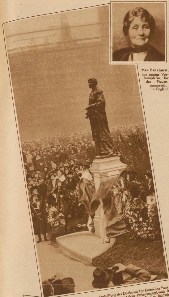
Enthüllung des Denkmals für Emmeline Pankhurst vor dem Parlamentsgebäude in London. Stanley Baldwin hielt die Weiherede