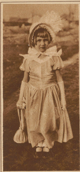
Nebenstehendes Bild links: Kleine Probe von der Fastnacht in Bellinzona: Die große Dame des 19. Jahrhunderts. Erstprämiertes Kostüm am Kinderball

Bild links: Ein neues Wunder der Technik: der Raketenkinderwagen am Fastnachtsumzug in Zürich