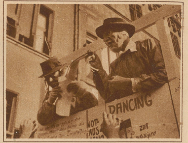
Humoristischer Wagen am Umzug in Basel