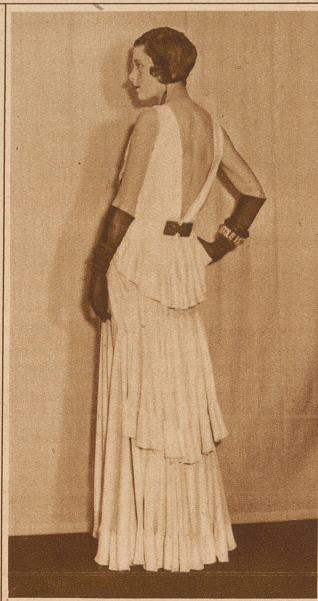
Eine raffinierte Weiß-Schwarz-Komposition (Modell Worth)

Eine weiße Welle türmt sich am Modehorizont. Weiß, nichts als weiß lautet die Parole. Weiße Waschseiden, glatte und fassionierte Crêpes de Chine sind Trumpf; das Piqué-Kostüm gilt als beachtenswerte Neuheit.