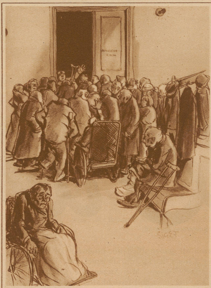
Nach Bezahlung von drei Schillingen werden die Kranken in den Auskleideraum hineingelassen