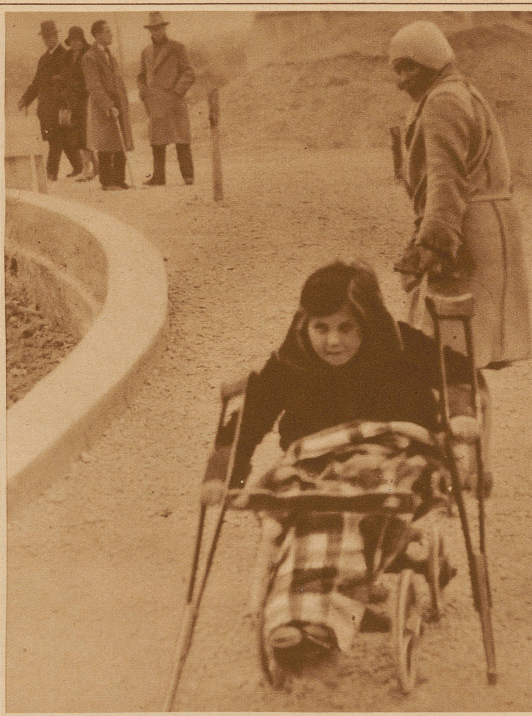
STRASSENBILDER AUS GALLSPACH Ein kleines Mädchen hilft mit seinen Krücken das Wägelchen stoßen