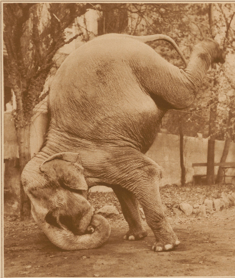
Elefantenfastnacht. Seitdem der Elefant hier einige Zeit in Europa zugebracht hat, fängt er an, Verständnis für die Fastnacht zu bekommen und macht auf seine Weise auch mit

Eine schwere Verantwortung laden sich solche Pfuhscher allerdings auf. Mit der in diesem Falle harmlosen