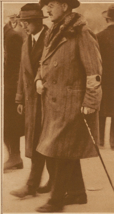
Selbst Blinde werden mit Hochfrequenzstrom bestrahlt