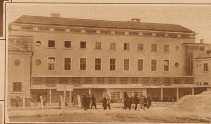
Untenstehendes Bild: Schloß Gallspach , die Privatwohnung von Zeileis

Bild rechts: Teilaufnahme des im Jahre 1929 eröffneten, mit einem Kostenaufwand von mehreren Millionen Schilling erbauten Institutes Zeileis, in dem zur Zeit täglich etwa 1500 Patienten behandelt werden