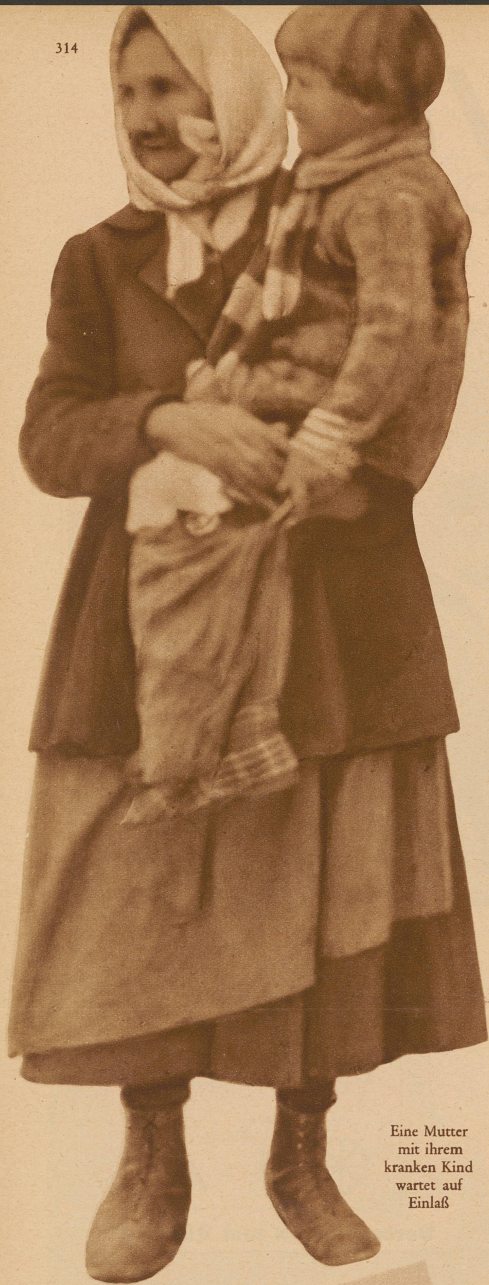
Eine Mutter mit ihrem kranken Kind wartet auf Einlaß