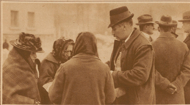
Einheimische von Gallspace. Kein einziger Gallsbacher möchte Zeileis hergeben. Der kleine Ort hat einen gewaltigen Aufschwung genommen. Die Bodenpreise sind gestiegen, Pensionen, Konditoreien und Hotels sind entstanden. Früher ein paar armselige Hütten, zählt Gallspace heute 600 Einwohner und beherbergt gegenwärtig, also außerhalb der Saison, 1500 Kurgäste. Die ganze Bevölkerung profitiert von den vielen aus ganz Oesterreich und dem Auslande hergereisten Hilfesuchenden

Ebenso wichtig wie der Kranken Leib ist die Seele des Patienten. Körper und Seele sind weitgehend von einander abhängig. Bei vielen Kranken kann keine Veränderung der Organe gefunden werden, die Krankheit ist nur eine Störung ihrer Tätigkeit. Solche Leiden werden als funktionelle Krankheiten bezeichnet, sie sind — oft unbewußt — von seelischen Erlebnissen verursacht und können wiederum durch solche behö-