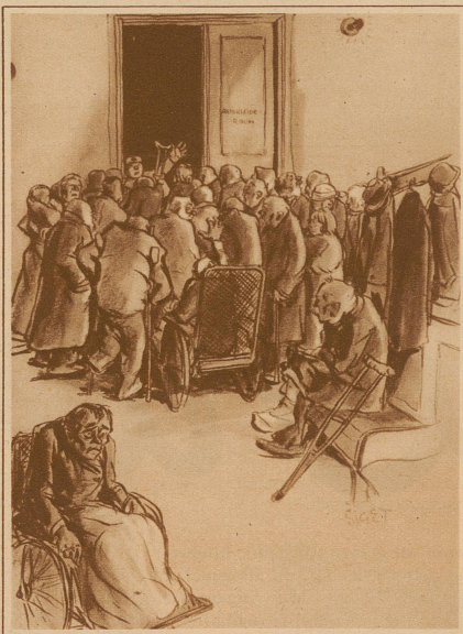
Nach Bezahlung von drei Schillingen werden die Kranken in den Auskleideraum hineingelassen