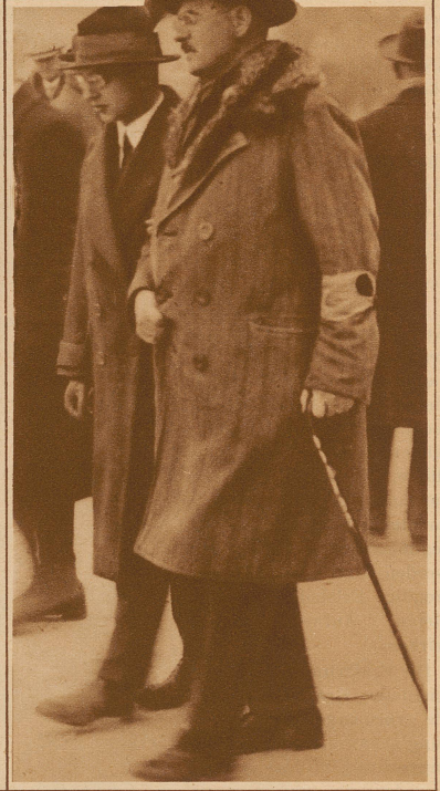
Selbst Blinde werden mit Hochfrequenzstrom bestrahlt