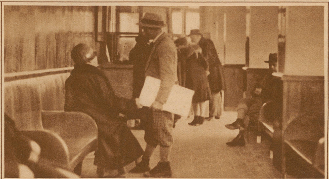
Die Hauptkasse ist immer von Patienten belagert. Die Behandlung findet für alle Hilfesuchenden 3mal im Tage statt. Die Kranken werden erst in den Behandlungsraum hereingelassen, nachdem sie an der Türe den für 3 Schilling erhältlichen Gutschein abgegeben haben