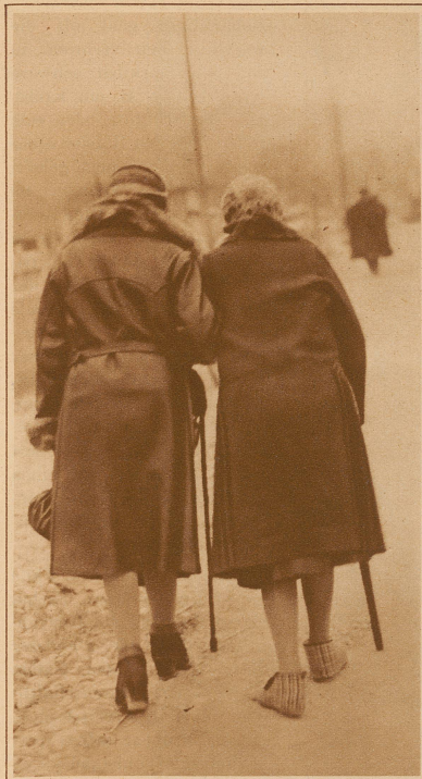
Kranke gesellen sich zueinander; das gemeinsame Leiden bringt sie einander näher