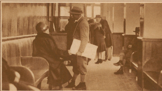
Die Hauptkasse ist immer von Patienten belagert. Die Behandlung findet für alle Hilfesuchenden 3mal im Tage statt. Die Kranken werden erst in den Behandlungsraum hereingelassen, nachdem sie an der Türe den für 3 Schilling erhältlichen Gutschein abgegeben haben