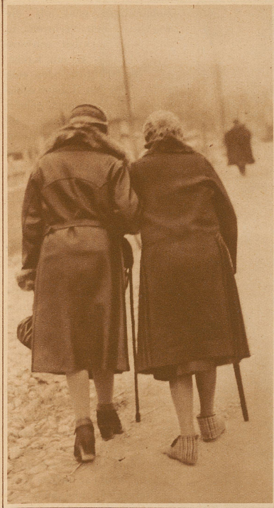
Kranke gesellen sich zueinander; das gemeinsame Leiden bringt sie einander näher