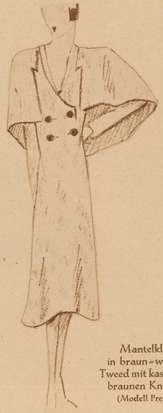
Mantelkleid in braun-weißem Tweed mit kastanienbraunen Knöpfen (Modell Premet)