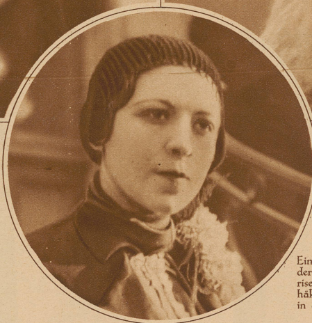
Eine neue Passion der eleganten Pariserin: handgehäkelte Kappen in der Farbe des Mantels