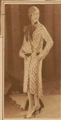
Bild links: Frühjahrmantel in apart gemustertem Wollstoff mit durchgezogenem Sämlingsgürtel. Neu ist die dem niederen Kragen angeheftete Echarpe