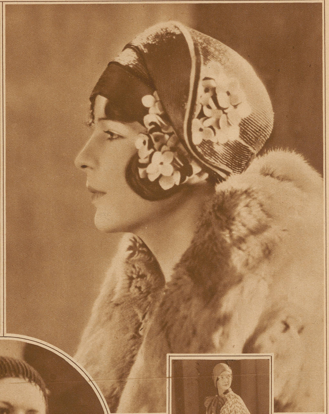
Der erste Strohhut mit Blumen