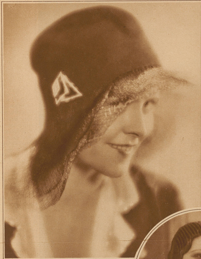
Filzhut mit Crin-Spige für den Uebergang