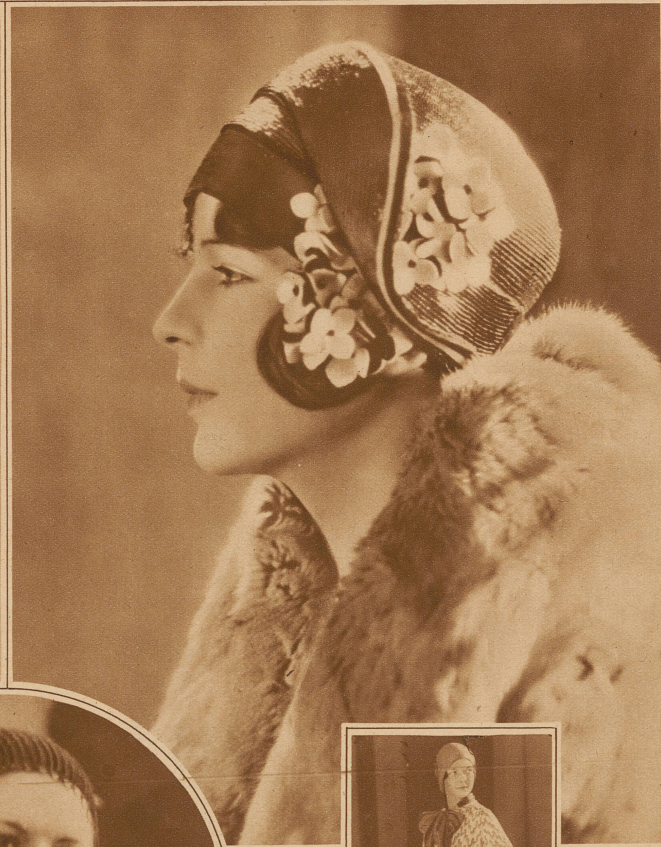
Der erste Strohhut mit Blumen

Aber daß er so frühzeitig ins modische Blickfeld tritt, ist Anzeichen einer «großen» Strohhut-Mode.