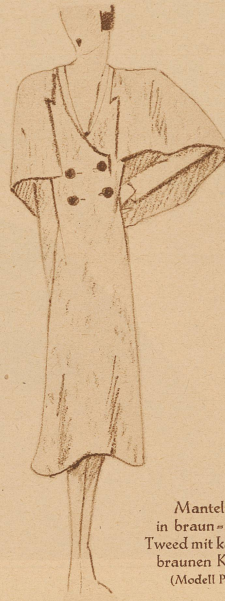
Mantelkleid in braun-weißem Tweed mit kastanienbraunen Knöpfen (Modell Premet)