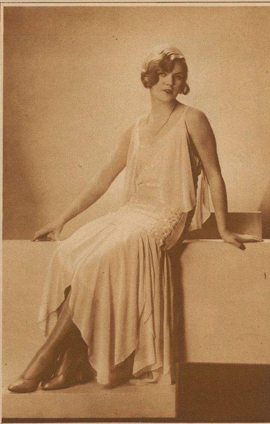
Abendkleid in Chiffon mit weißer Seide bestickt Modell Drecolli-Beer