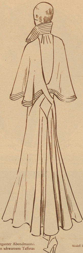
Sehr eleganter Abendmantei in schwarzem Taffetas

Die bei diesen streng sachlichen Vorführungen herrschende Mentalität würde alle diejenigen höchst eigentümlich berühren, die sich gewohnt und bei unsern Modeschauen von Musik umschmeichelt und mit Tee und Patisserie gestärkt zu werden. Den Sang und Klang ersetzen Modellnamen und Nummern, und nachträglich vier- und fünfstelligen Zahlen. Wenn auch der bereits bekannte oder ausreichend legitimierte Einkäufer von seiner «vendeuse» liebenswürdig begrüßt wird, so postiert sie sich doch bei Eintritt des ersten Mannequins gleich einem Detektiv hinter und dicht neben ihm. Weiß sie doch ganz genau, daß auch der Einkäufer mit der