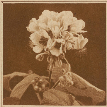
Blüte der Zimmerlinde

Nicht nur die langen Kleider, sondern auch die langen Haare und damit die alte Gewohnheit unserer Mütter und Großmütter, die Haarnadel in den Mund zu stecken