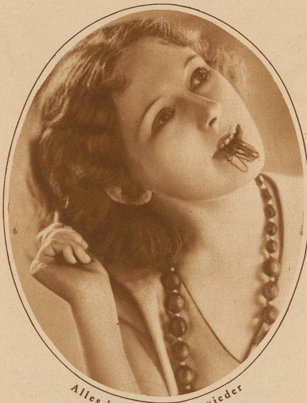
Alles kommt einmal wieder

Nicht nur die langen Kleider, sondern auch die langen Haare und damit die alte Gewohnheit unserer Mütter und Großmütter, die Haarnadel in den Mund zu stecken