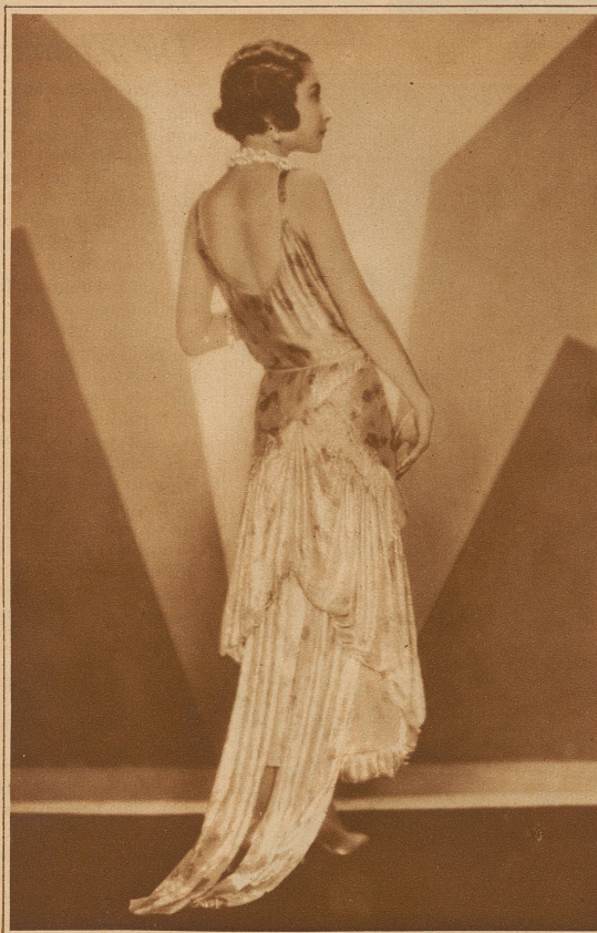
Elegantes Abendkleid in Silberlamé mit rosa Rosen, um den Hals dop- pelt umgelegte glänzende, schwere Kri- stallkette Modell Lucien Lelong

Vermittelnde Hilfskräfte beim interessanten wirtschaftlichen und psychologischen Komplex sind die