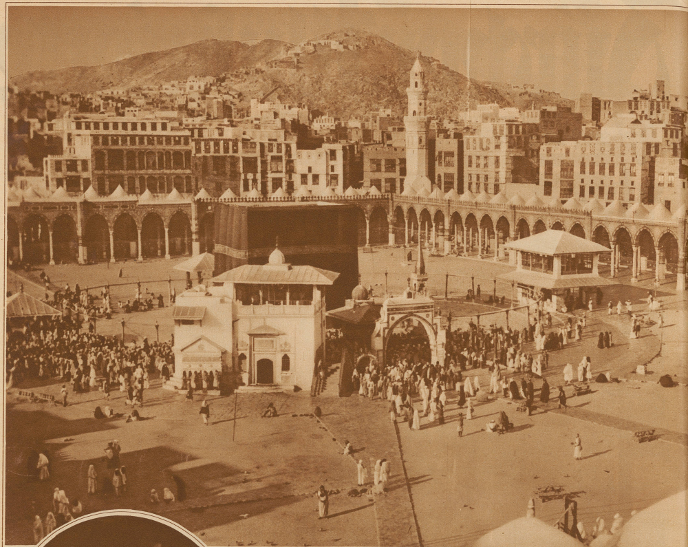
Blick in den Innenhof der Kabba in Mekka, wo jährlich Hunderttausende von Pilgern ihre Gebete verrichten und den heiligen Stein küssen