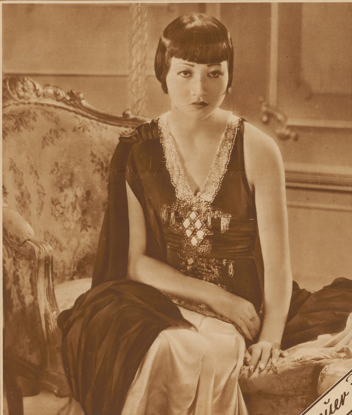
Anna May Wong in Zürich

Ausschlaggebend für die Abnahme durch die Aktiengesellschaft der Unternehmungen Rudolf Mosse, Zürich, Basel, Bern und Agenturen + Anzeigenpreise: 45 Cts. pro Millimeterzeile