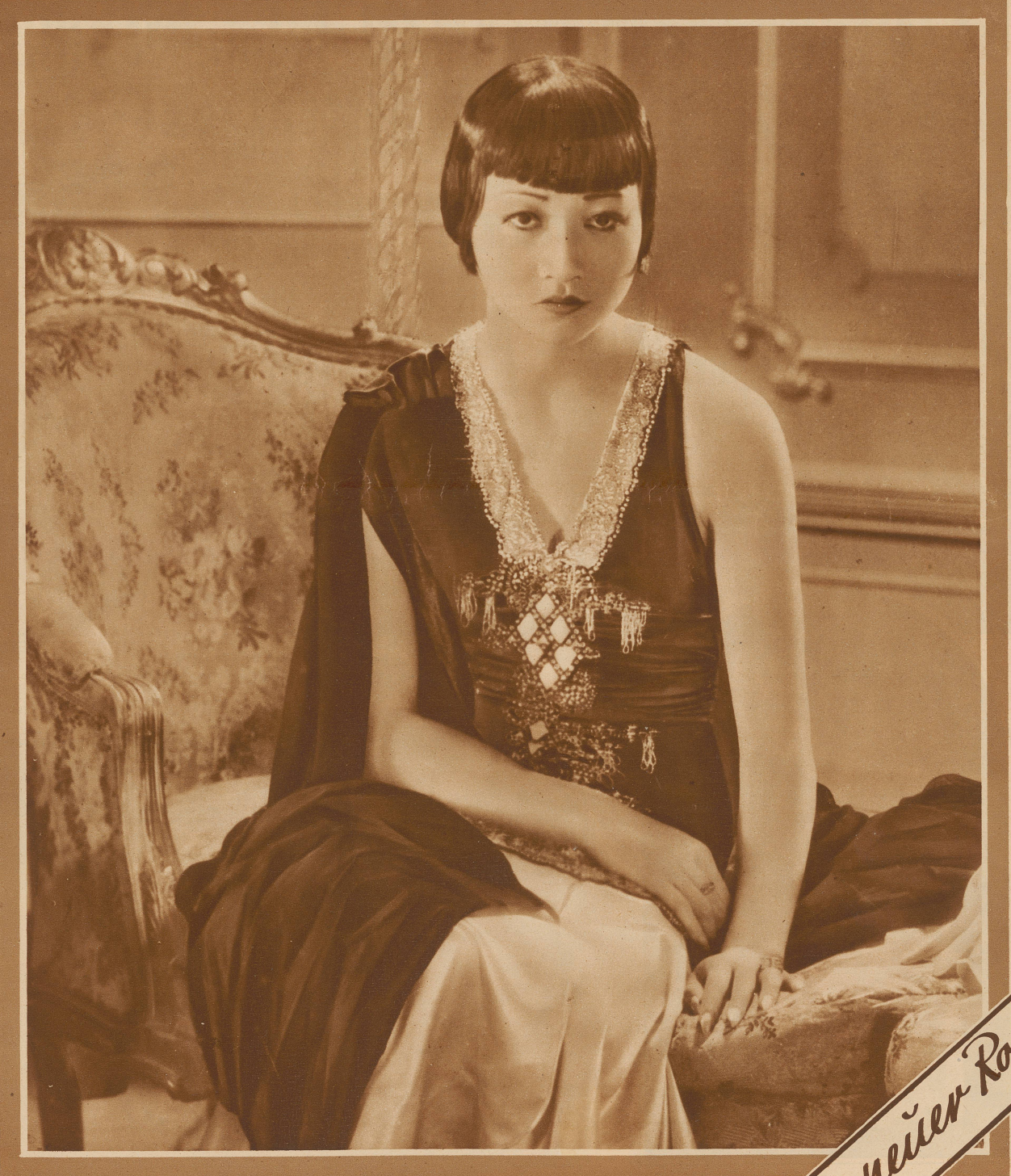
Anna May Wong in Zürich

Ausschlaggebend für die Aufnahme durch die Altiengefellshaft der Unternehmungen Rudolf Mosse, Zürich, Basel, Bern und Agenturen + Anzeigenpreise: 45 Cts. pro Millimeterzeile