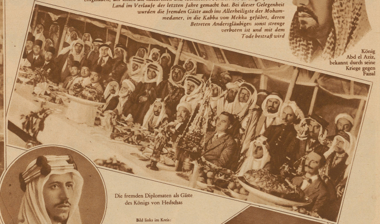
Die fremden Diplomaten als Gäste des Königs von Hedschas