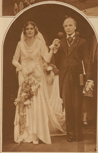
Ein neues und doch bekanntes Paar.

Dieser Tag fand in Berlin die Trauung des Filmregisseurs und bekannten Schauspielers Dr. Karl Ludwig Achaz-Dieter mit der Filmdiva Viola Garden statt, die kürzlich in einem von ihren letzten Gemälden (szenariert von Film »Sprengbagger 1010«) die weibliche Hauptrolle spielte. Im Bild zeigt das neue Paar beim Verlassen der Kirche.