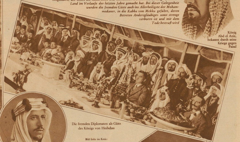
Die fremden Diplomaten als Gäste des Königs von Hedschas