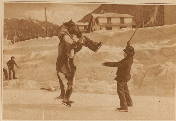
EISZIRKUS IN DAVOS

Dieser Tag fand in Berlin die Trauung des Filmregisseurs und bekannten Schauspielers Dr. Karl Ludwig Achaz-Dieter mit der Filmdiva Viola Garden statt, die kürzlich in einem von ihren letzten Gemälden (szenariert von Film »Sprengbagger 1010«) die weibliche Hauptrolle spielte. Im Bild zeigt das neue Paar beim Verlassen der Kirche.