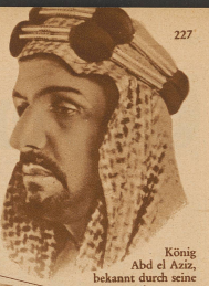
König Abd el Aziz, bekannt durch seine Kriege gegen Faisal

König Abd el Aziz von Hedschas hat eine Anzahl ausländische Diplomaten und Journalisten eingeladen, um ihnen die kulturellen und technischen Fortschritte zu zeigen, die sein Land im Verlaufe der letzten Jahre gemacht hat. Bei dieser Gelegenheit wurden die fremden Gäste auch ins Allerheiligste der Mohammedaner, in die Kabba von Mekka geführt, deren Betreten Andersgläubiger sonst strenge verboten ist und mit dem Tode bestraft wird