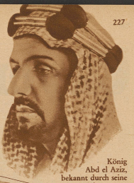
König Abd el Aziz, bekannt durch seine Kriege gegen Faisal

König Abd el Aziz von Hedschas hat eine Anzahl ausländische Diplomaten und Journalisten eingeladen, um ihnen die kulturellen und technischen Fortschritte zu zeigen, die sein Land im Verlaufe der letzten Jahre gemacht hat. Bei dieser Gelegenheit wurden die fremden Gäste auch ins Allerheiligste der Mohammedaner, in die Kabba von Mekka geführt, deren Betreten Andersgläubigen sonst strenge verboten ist und mit dem Tode bestraft wird.