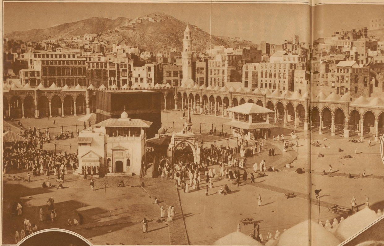
Blick in den Innenhof der Kabba in Mekka, wo jährlich Hunderttausende von Pilgern ihre Gebete verrichten und den heiligen Stein küssen