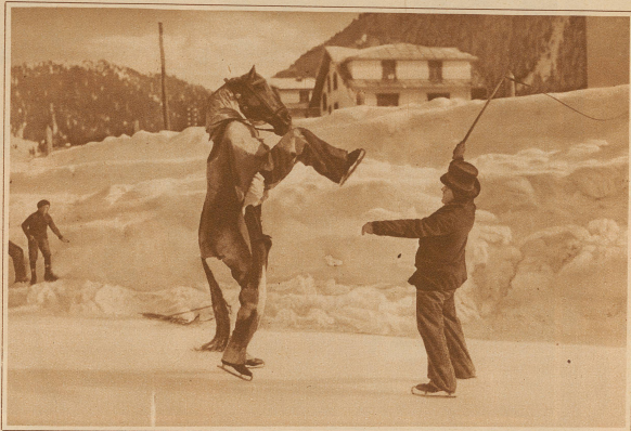
EISZIRKUS IN DAVOS

Dieser Tage fand in Berlin die Trauung des Filmregisseurs und bekannten Schauspielers Dr. Karl Ludwig Achaz Döbner mit der Filmdiva Viola Garden statt, die einstweilen im einen von ihrem jetzigen Gemahl inszenierten Film »Sprengbagger 1010« die weibliche Hauptrolle spielte. Im Bild zeigt das neue Paar beim Verlassen der Kirche