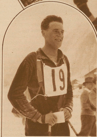
WALTER BUßMANN Luzern Schweizer Skimeister 1930