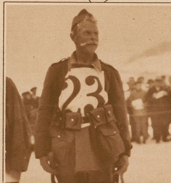
Ein strammer «Gebirgler» gibt seinem Vorgesetzten freudig Auskunft über die 25 km lange Fahrt