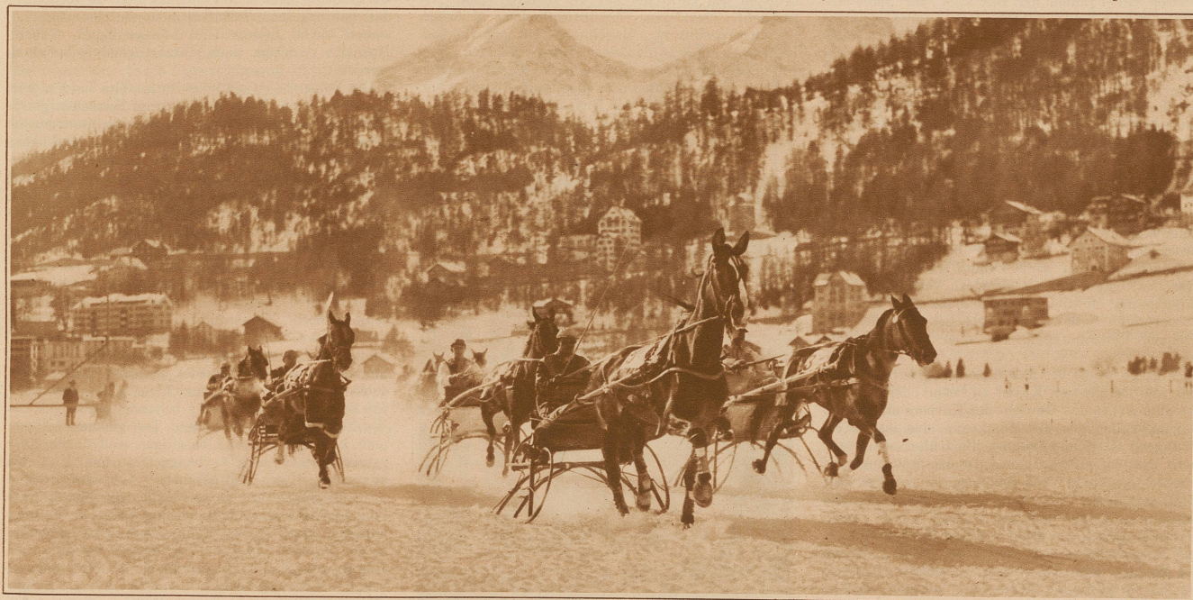
Pferderennen in St. Moritz. Traber im Rennen