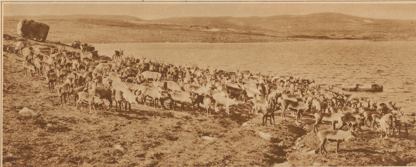
AN DER TRÄNKE