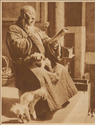
Gelehrter Mönch aus dem fernen Osten