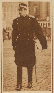
Der König von Dänemark bei ei- nem Spaziergang in den Straßen Kopenhagens