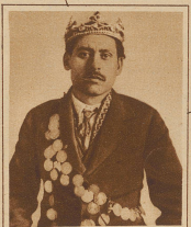
Der König der Zi- geuner, Michael II. de Roumanie, bei Warschau treffen sich alle Jahre an einem bestimmten Tage die Delegier- ten aller polnischen Zigeunerskizzen und wäh- len ihren eigenen König. An der «Landsgemeinde» nehmen irwenn auch Delegierte der Landesregie- rung und der Po- litikbehörden teil, die die gesetzliche Wahl bestätigen