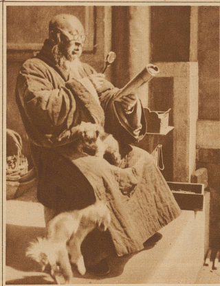
Gelehrter Mönch aus dem fernen Osten

Der König von Dänemark bei ei- nem Spaziergang in den Strassen Kopenhagens