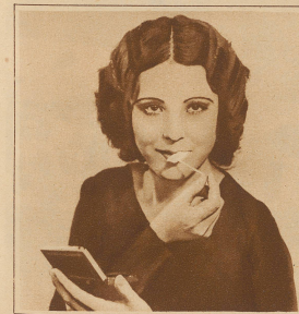
Bild unten: Die Filmschauspielerin befaßt sich weniger mit dem Lose ihrer Männchen als mit ihrem eigenen und hat für ihre Schönheitspflege neben einem Lippenstift erfinden, den sie erst auf die Schminke, dann auf die Lippen drückt, so daß sie sich die Arbeit der Handmalerin erspart