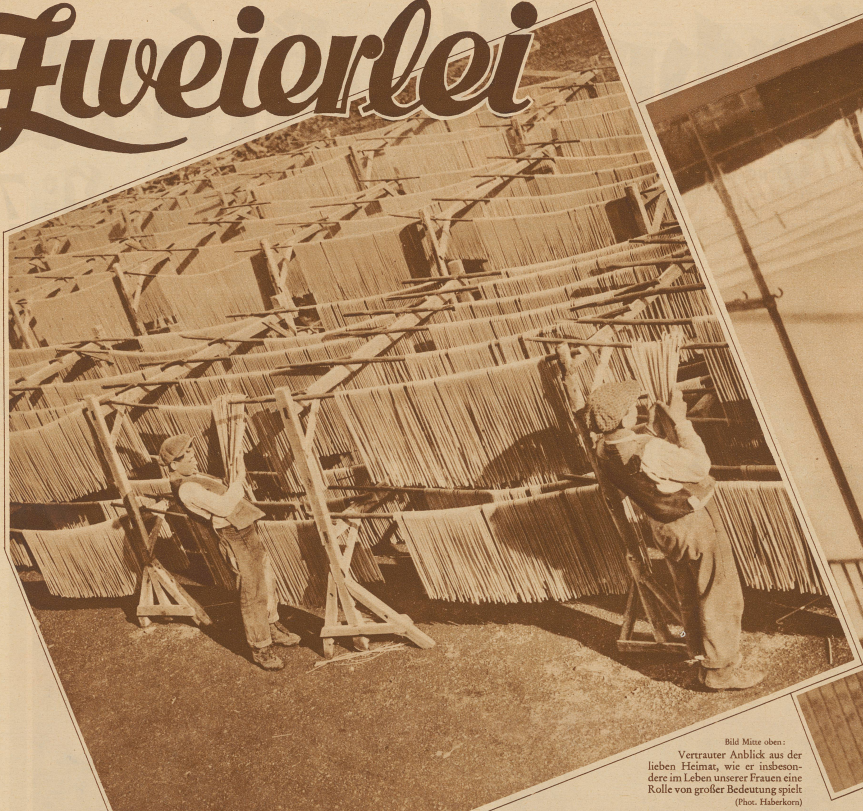
Bild Mitte oben: Vertrauter Anblick aus der lieben Heimat, wie er insbeson- dere im Leben unserer Frauen eine Rolle von großer Bedeutung spielt