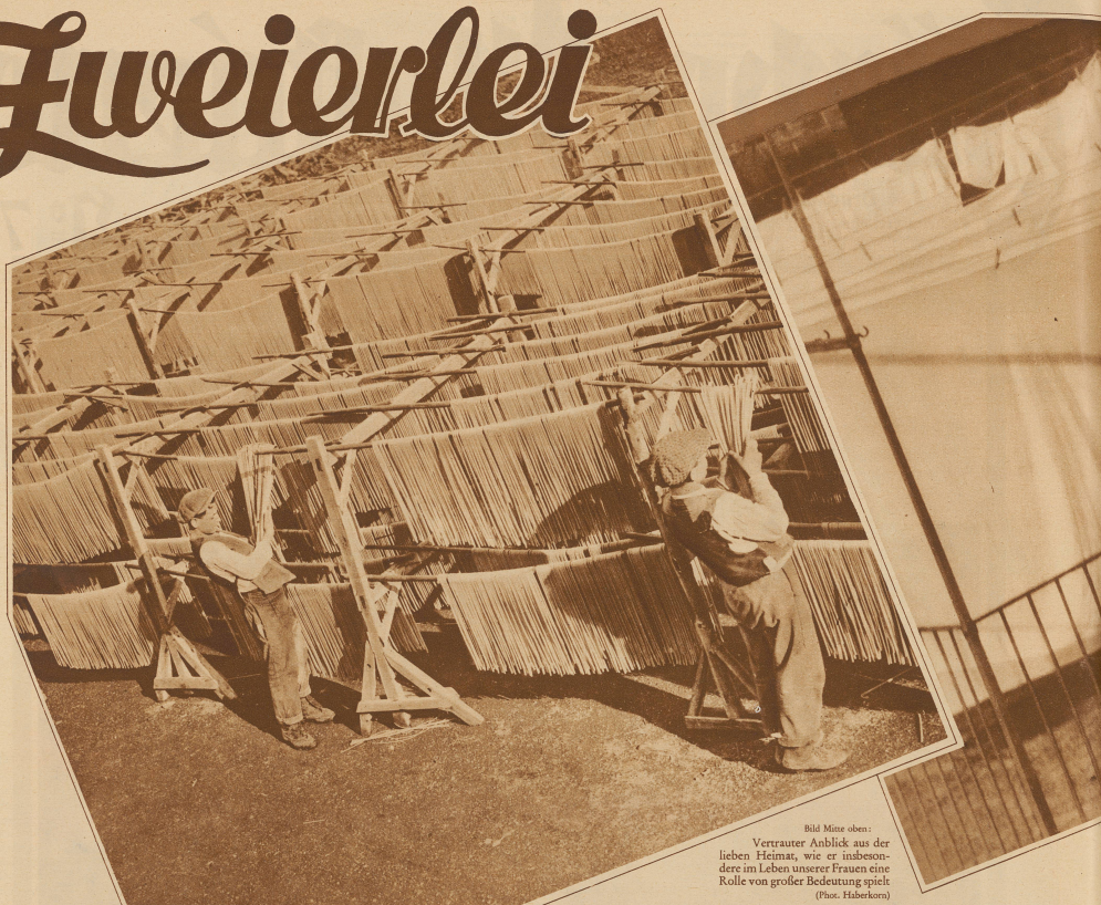
Bild Mitte oben: Vertrauter Anblick aus der lieben Heimat, wie er insbeson- dere im Leben unserer Frauen eine Rolle von großer Bedeutung spielt

Neapolitanische Makkaronifabrik, wo die frisch gemachten Teigfäden oder Röhren an der Luft getrocknet werden