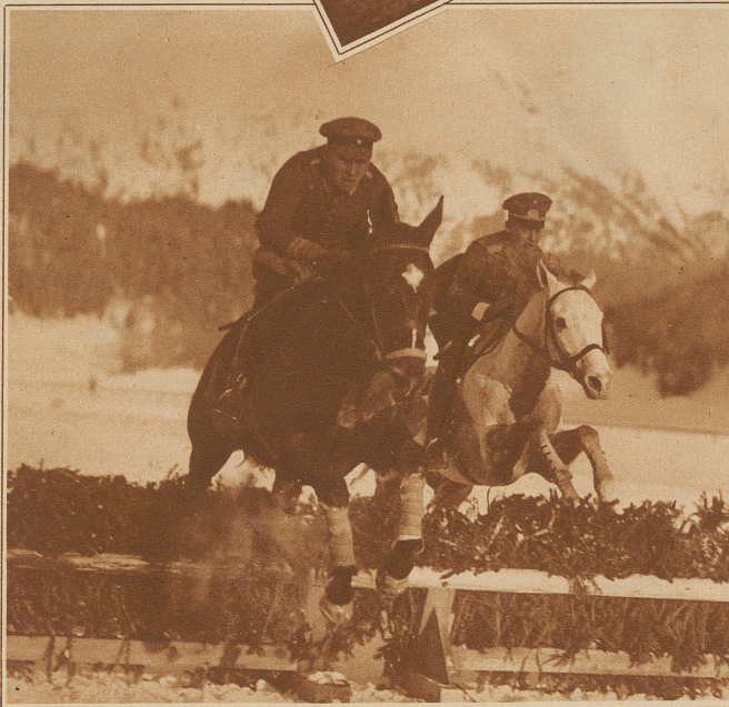
Aus dem Hürdenrennen für Offiziere um den «Preis von Basel». Ausländische Offiziere im Rennen.