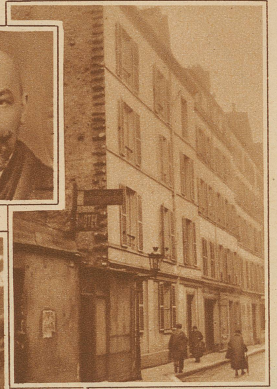
Das Haus, das der General kurz vor seiner Entführung verlassen hat. Links oben im Bilde: Der entführte General Kutjepow