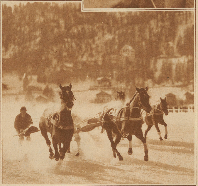
Der scharfe Finish im Skijöring um den «Preis vom Inn».