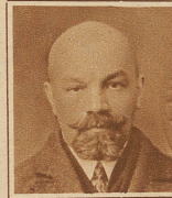
Bild links nebenstehend: MAX VALIER, der Erfinder des Raketenautos, hielt in Zürich einen Vortrag über das Thema: «Vom Raketenwagen zum Weltraumschiff».

Paris hat eine neue Sensation. Der russische General Kutepow ist am helllichten Tage in einer belebten Straße auf geheimnisvolle Weise spurlos verschwunden. Wie Augenzeugen versichern, haben ihn zwei Männer in einem Auto gewaltsam entführt. Man vermutet einen Racheakt der Bolschewisten. General Kutepow war Führer der antibolschewistischen russischen Kolonie.