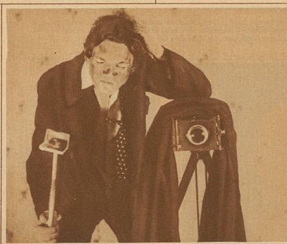
Ganz schwarz war er im Gesicht