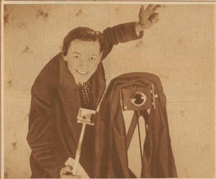
Bitte recht freundlich!

Auflösung des Rätsels aus letzter Nummer FUSS