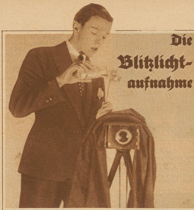
Man muß mit dem Blitzlicht vorsichtig umgehen