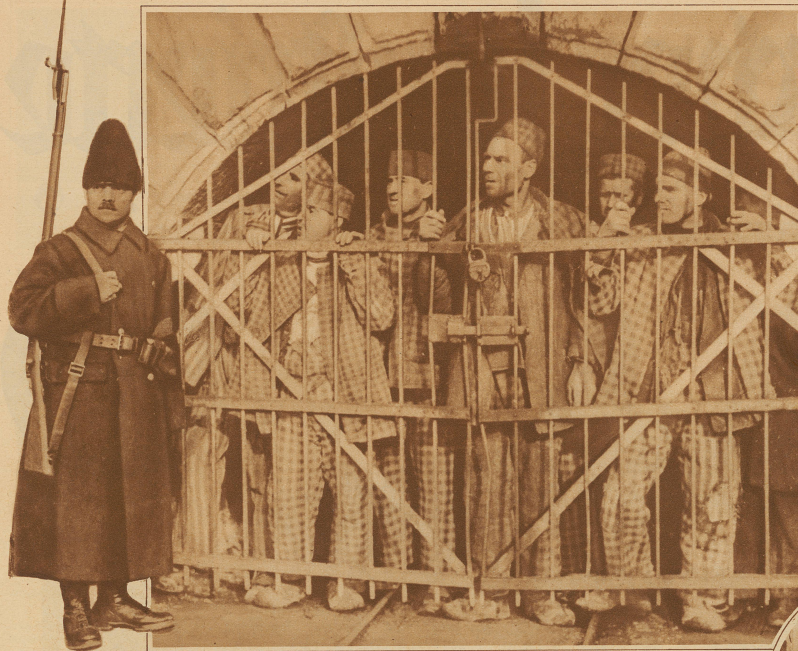
In den Salzbergwerken Rumäniens werden Sträflinge beschäftigt, die zur Zwangsarbeit verurteilt sind. Unter starker Bewachung führt man sie vom Gefängnis zu den Arbeitsstellen. In den Ortschaften, die passiert werden, ist jeder Straßenverkehr verboten, bis die Sträflinge vorbei sind. Auf unserm Bild sehen wir die Gefangenen hinter dem Hauptgitter.

Unersetzliches Bild: Kein Bild von Mittelholzers Jagdexpedition nach Ostafrika, sondern ein Blick in den «Garten der vorgeschichtlichen Tiere» beim Kristallpalast in London. Man putzt und malt die Ungeheuer neu, weil man nämlich glaubt, daß der Frühling bald komme und mit ihm die Spaziergänger.