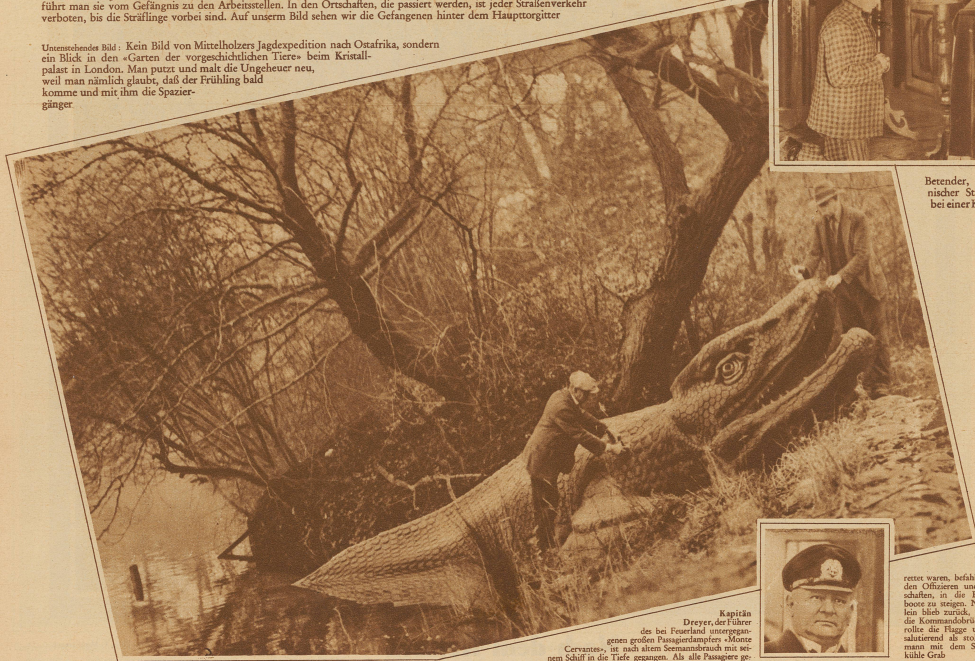
Kapitän Dreyer, der Führer des bei Feuerland untergegangenen großen Passagierschiffes «Monte Cervantes», ist nach altem Seemannsbrauch mit seinem Schiff in die Tiefe gegangen. Als alle Passagiere ge-

Unersetzliches Bild: Kein Bild von Mittelholzers Jagdexpedition nach Ostafrika, sondern ein Blick in den «Garten der vorgeschichtlichen Tiere» beim Kristallpalast in London. Man putzt und malt die Ungeheuer neu, weil man nämlich glaubt, daß der Frühling bald komme und mit ihm die Spaziergänger.