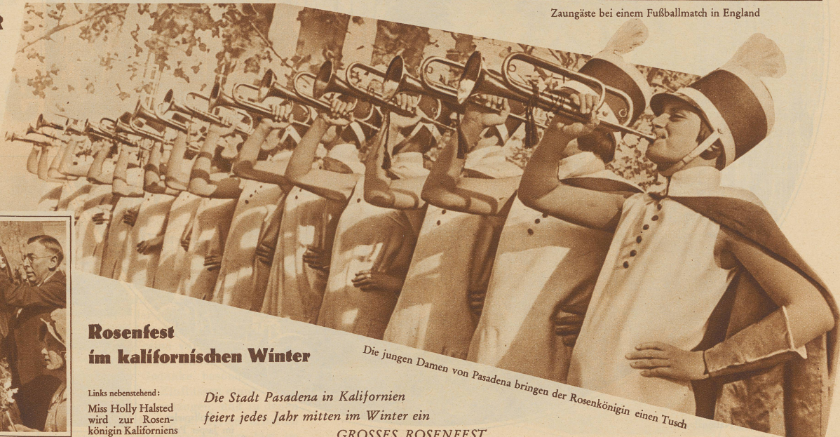
Die jungen Damen von Pasadena bringen der Rosenkönigin einen Tusch Die Stadt Pasadena in Kalifornien feiert jedes Jahr mitten im Winter ein GROSSES ROSENFEST

Es ist fast nicht zu glauben, daß noch im Jahre 1930 Menschen in solch licht- und sonnenlosen Winkeln hausen müssen. Die Gesundheitspolizei hat nun allerdings beschlossen, dieses nur 2,50 Meter breite Gäßchen — es hat übrigens den verheißungsvollen Namen «Rue de Venise» — mit möglicher Beschleunigung zu räumen und niederzureißen