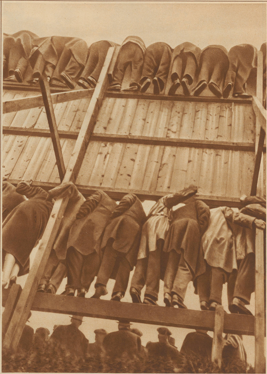
Zaungäste bei einem Fußballmatch in England