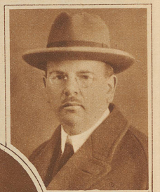
Generaldirektor Adolf Baumann, Mitglied der Generaldirektion des Schweizerischen Bankvereins, starb im Alter von erst 48 Jahren. In ostschweizerischen Handels- und in osteuropäischen Bank- und Industriekreisen erfreute sich der gewiegte Fachmann eines besonderen Ansehens