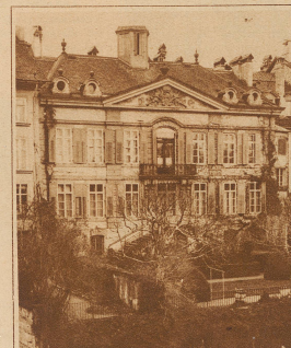
kostbaren alten Gobelins und Gemälden geschmückte Gebäude später als Empfangspalais zu verwenden