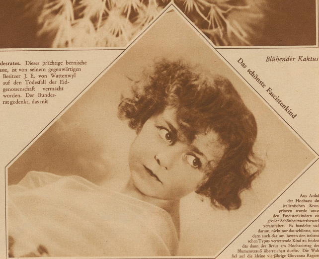
Das schönste Fasstistenkind