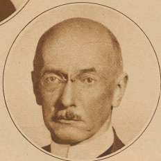
Bild rechts: J. J. NEF-KERN Präsident des Kaufmännischen Direktoriaus in St. Gallen, eine führende Persönlichkeit der Seidenindustrie, auch im Alter von 65 Jahren. Nef, in früheren Jahren britischer Konsul, gehörte seit 1925 dem Bankrat der Schweizerischen Nationalbank an