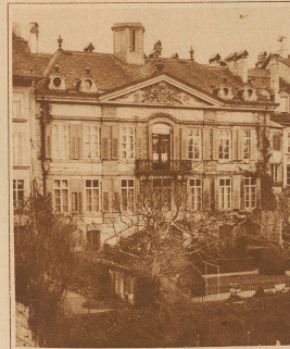
kostbaren alten Gobelins und Gemälden geschmückte Gebäude später als Empfangspalais zu verwenden