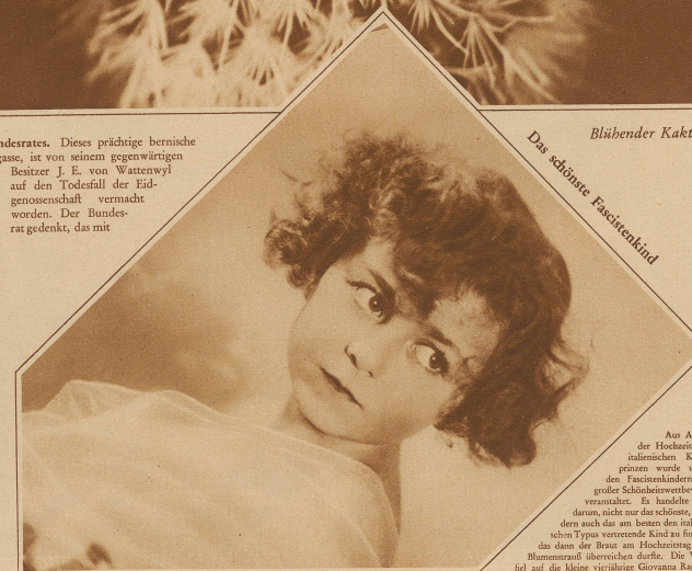
Das schönste Faschistenkind