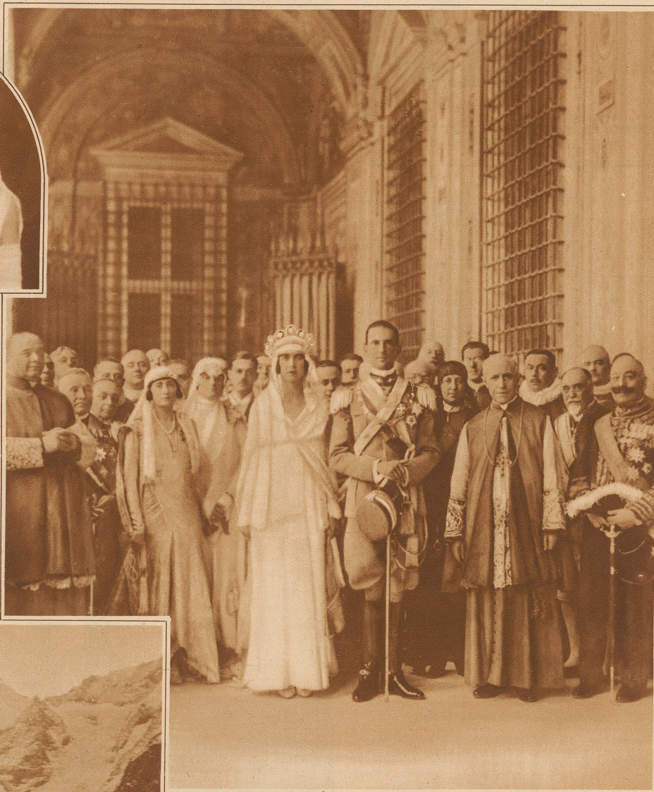
Das neuvermählte Paar im Vatikan, bereit, den Segen des Papstes zu empfangen