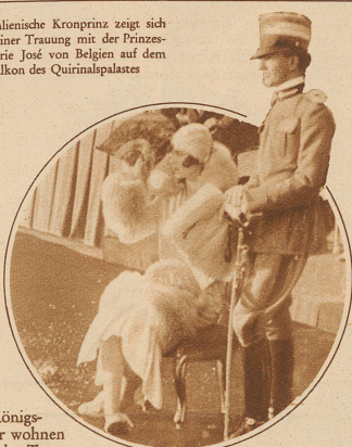
Die Königin und der König der Niederlande wohnen nach der Trauung einer zu ihren Ehren veranstalteten großen Parade bei