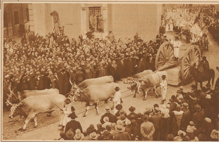
Am Tage der Vermählung fand in Rom ein interessanter Trachtenumzug statt, der das bodenständige Italien von den Alpen bis Sizilien zeigte. Viel Beachtung fand dabei der im Bilde festgehaltene Ochsenzug mit einem viele Zentner schweren Marmorblock