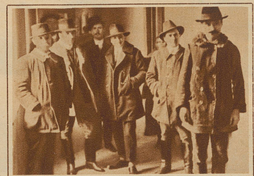
Dem Gifftod entronnene Bauern, die nun als Zeugen gegen ihre Frauen auftreten

den lassen wollte. Und als ihr einst ein Liebhaber vorhielt, daß sie bereits einen 23jährigen Sohn habe, gab sie auch diesem kalten Blutes Arsenik ein. — Im Gefängnishofe von Szolnok kann man sie täglich bei der Mittagsrunde sehen, all diese unheimlichen Frauen. Stumm, mit gesenkten Augen, die Hände wie zum Gebet gefaltet, so wandeln sie — immer im Kreis herum. Wenn sie einen Zuschauer bemerken, dann heben sie mit einer zornigen Bewegung den Kopf und einen Augenblick lang kann man in ein unheimlich flackerndes Augenpaar und ein gespenstisch eckiges Gesicht sehen. Die Frauen von Nagyrev fürchten den Tod. Sie fürchten das unheimliche Gespenst, das sie Jahrzehnte hindurch immer wieder heraufbeschworen haben und das nun nach ihnen selbst seine dunklen Hände ausstreckt.