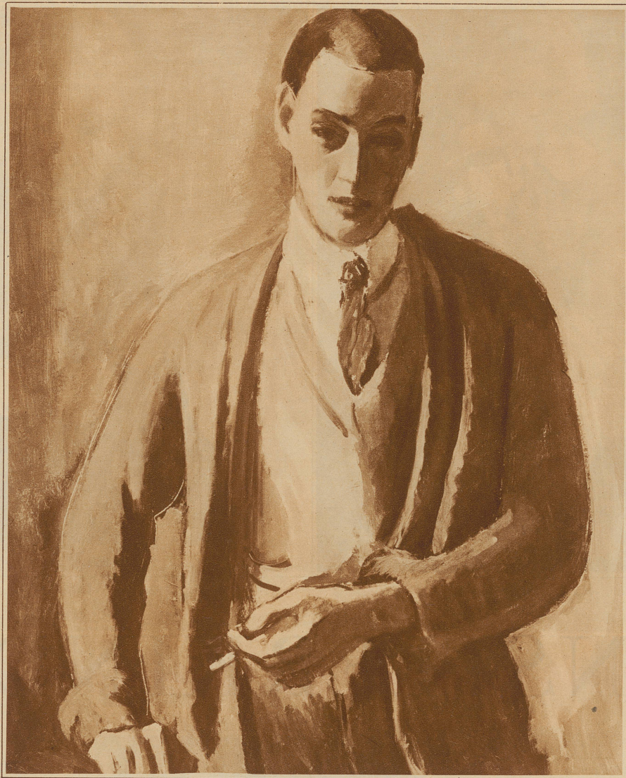
Porträt Heinrich Barth.

Vorstellung nicht mit der Körperlichkeit des wirklichen Seins verbinden kann. Und es ist auch interessant zu sehen, daß gerade diese Kinderbilder stets den Eindruck harter Mühe hinterlassen, was wohl zu einem großen Teil auch daher kommt, daß sich die Physiognomie rasch verändert und immer wieder neu gefaßt sein will. Wenn wir einige Kinder von Schweizer Künstlern im Bilde betrachten, dann