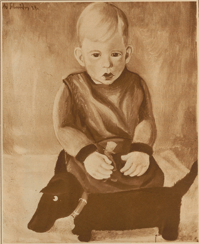
«Hansli» von Adolf Schnider, Küssnacht