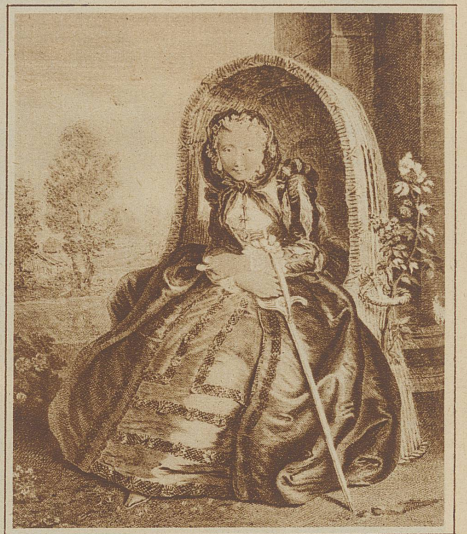
Aus der Zeit des Rokoko

lichen Landen sein Frauenideal. Schon rein äußerlich handfester geartet, in runder, weiblicher Fülle, blond, mittelgroß, sollte ihr Sinn auf realerem Boden stehen. Da wollte der Mann die schaffensfreudige Hausfrau und treu sorgende Mutter. Ein warmer Hauch herzlicher Innigkeit und trauter Häuslichkeit weht uns aus dieser Welt entgegen. Doch die Frauen begingen zwei große Fehler: Sie waren nur Hausfrau und viel zu bescheiden. Dadurch leisteten sie dem Egoismus des Mannes Vorschub und er verlor ihnen gegenüber die Ritterlichkeit.