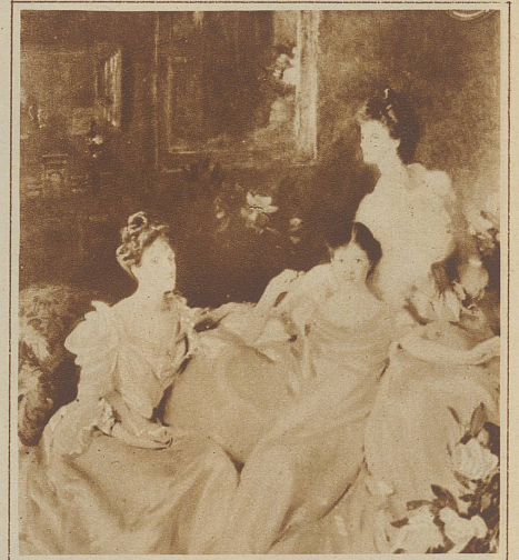
Die drei Frauen Gemälde von Sargent. Ein charakteristisches Bild für die hochbürgerliche Eleganz vom Anfang des Jahrhunderts

Die Renaissance formte sich das Idealbild der Frau um zu einem sphinxhaften Wunder, wie es uns in Leonardos unsterblichem Kunstwerk der Mona