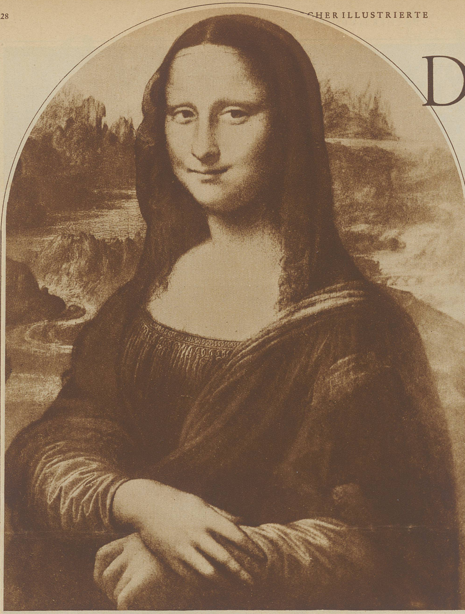
Mona Lisa. Gemälde von Leonardo da Vinci. Ein Beispiel für den Schönheitstyp der klassischen Renaissance

Zu allen Zeiten war die edle Frau der gute Genius des Mannes.