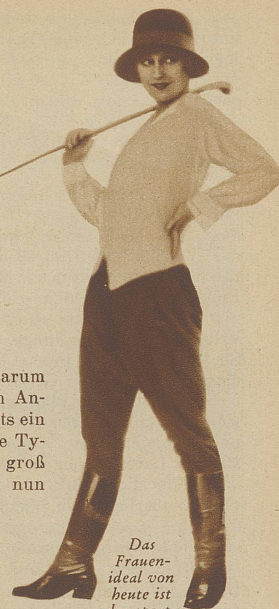
Das Frauenideal von heute ist der sportlich trainierte, vermännlichte Typ

allzu harten Müttern. Darum suchte sich die Welt im Anfang des 20. Jahrhunderts ein anderes Ideal. Der neue Typus war noch immer groß und hoheitsvoll, doch nun blond und schlank. Wie fraulich und reizend waren diese Frauen, distinguiert,