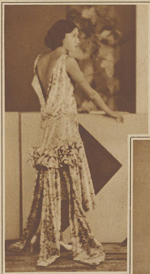
Eine Reminiszenz an die «Rüschen» der 1860er Jahre in einer zum «Absitzen» wohl kaum sehr vorteilhaften Plazierung

Stoffbild der Frau in einer würdevollen Form von Adel und Anmut. / Frauenmode ist — nach der Ansicht Norbert