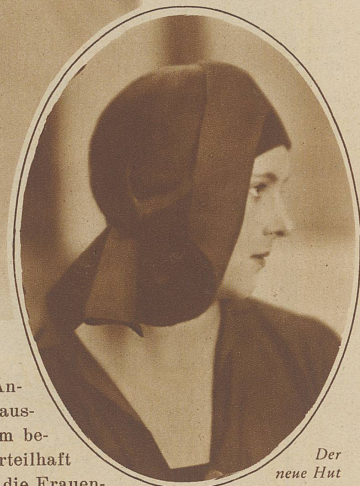
Der neue Hut