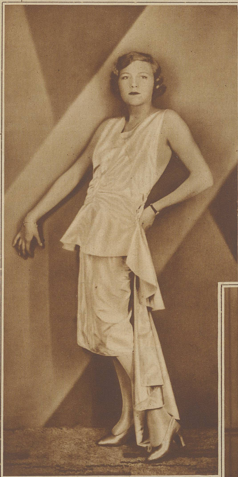
Das griechische «Peplum» in moderner Auffassung

leben eine weitaus größere Rolle spielen muß, als im Dasein des Mannes, der — wie Georg Simmel einmal andeutet — der Abwechslung in der Kleidung deshalb eher entraten kann, nicht nur, weil sich ihm in vielen anderen Gebieten mehr Abwechslung bietet, sondern weil er der «untreueren» Teil der Menschheit ist und auch in seiner Beziehung zum andern Geschlecht entschieden mehr der Abwechslung zu leben in der Lage ist! / In der Regel sind es auch die feinsinnigsten, am ent-