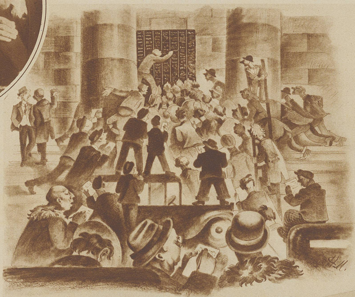
Die Börse steigt. Die Kurstafel erfreut sich großer Aufmerksamkeit und Anziehungskraft

Dies ist nicht der Börsensaal, wo die offiziell zum Handel zugelassenen Papiere gekauft und verkauft werden, dies ist vielmehr ein Blick auf die Kulissen, die Börse in der Vorhalle. Im großen ganzen geht's hier gleich zu wie im Innern, nur handelt es sich um andere Wertpapiere, deren Zulassung zur offiziellen Börse aus irgendeinem Grunde unterblieben ist. Die Kurse werden von den Maklern, den Börsianern und Händlern auf Grund von Angebot und Nachfrage gehandelt, werden sichtbar an eine Tafel geschrieben, bei jeder Veränderung ausgemischt und neu hingemalt.