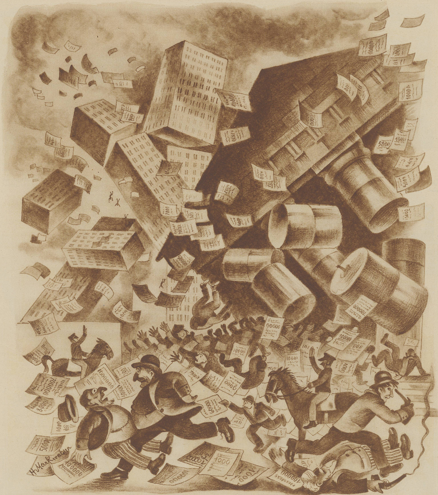
Die Börse fällt. Bild vom New-Yorker Börsensturz, nach dem Spruch: «Ist nur Geld deine Welt, dann ist der Verlust des Geldes dein Weltuntergang»

Welt, nicht zuletzt auch in der Schweiz, verdienten die großen und kleinen Spekulanten an der Hausse, also am Steigen der amerikanischen Papiere. Seit langem aber fehlte dem ganzen Treiben die rechte Grundlage. Die Werke drüben waren nicht im Werte so gestiegen, wie man nach den Aktienkursen hätte glauben können. Die Papiere waren überbewertet. Vorsichtige ahnten das seit langem. Sie fingen an zu verkaufen. Aber die Nachfrage nahm ab. Sehr rasch! Je mehr Papiere auf den Markt kamen, um so mehr fiel die Kauflust und damit das Papier. Und plötzlich ging's wie eine Erleuchtung, wie ein Sturm,