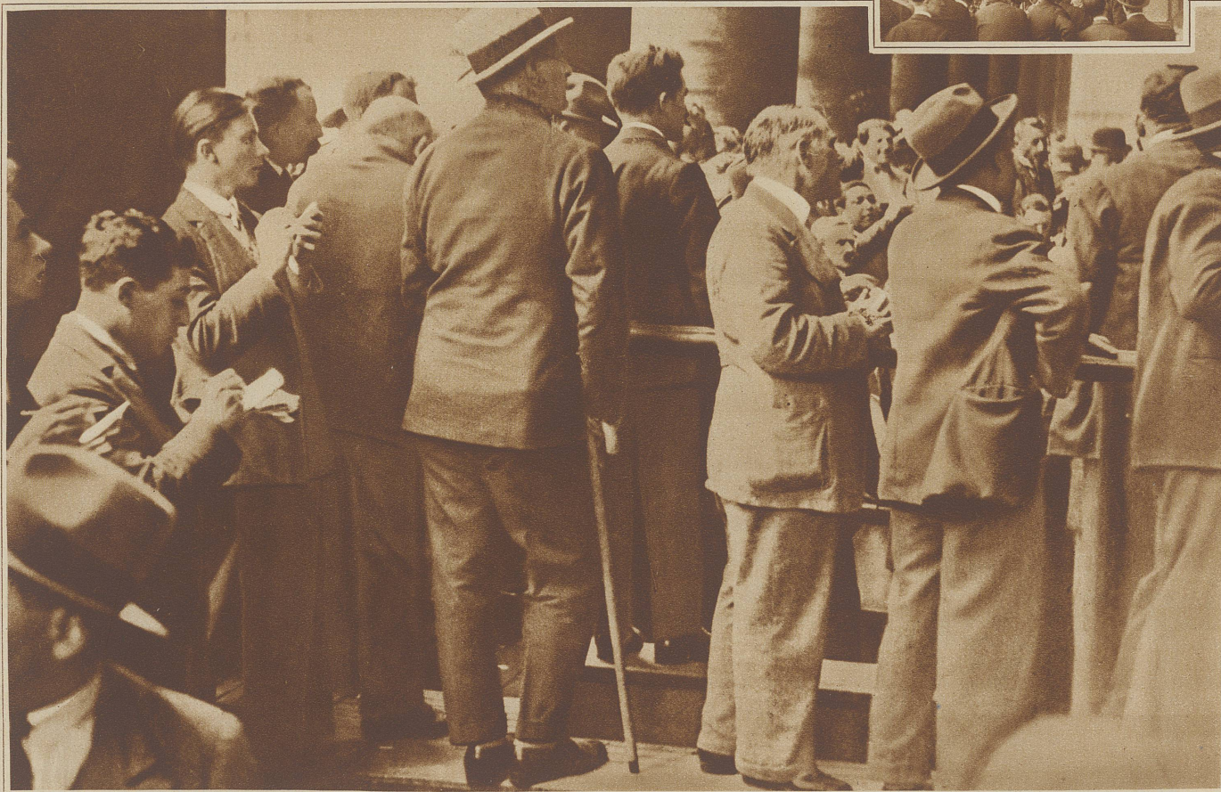
Alle Blicke sind auf die Kurstafel gerichtet