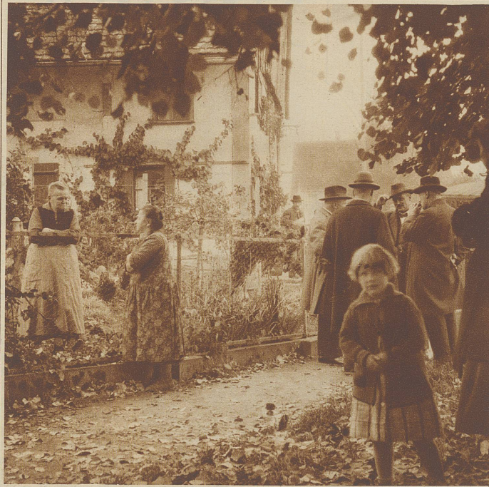
Da und dort stehen Gruppen im Gespräch über den Mord