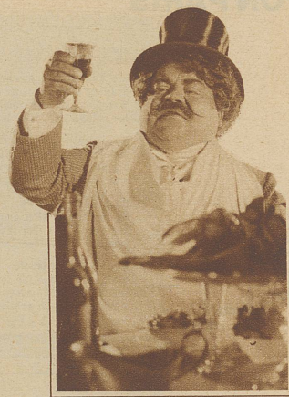
Kein Gast für den kultivierten gedeckten Tisch

Es gibt Frauen, die an nichts mehr Freude haben, als für Gäste den Tisch besonders schön herzurichten. Nicht immer aber ist dieses «schön» auch geschmackvoll. Die Art, wie wir den Tisch decken, verrät eine ganz bestimmte Kultur. Für unsere Zeit ist's charakteristisch, daß sich diese Kultur wie von einem Zuviel der Speisenfolge, auch von prahlerischer Ueberladung mit Tafelschmuck abwendet.