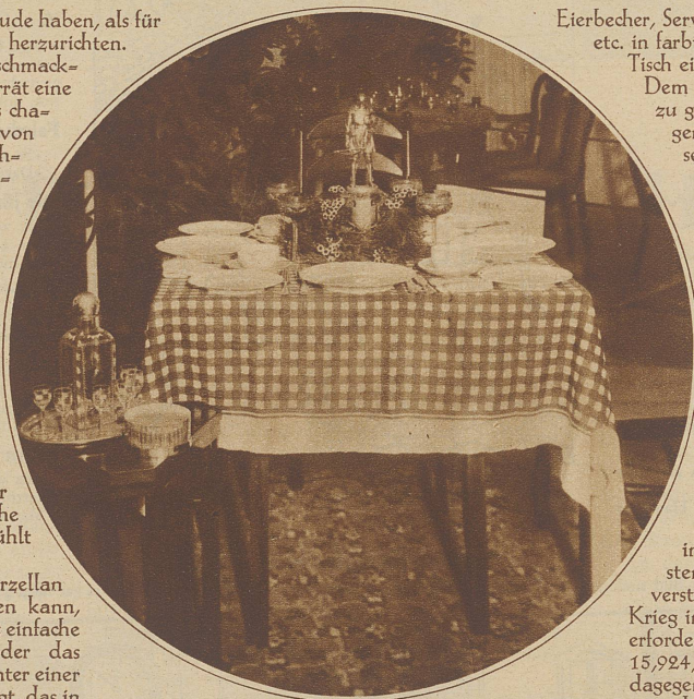
Wenn gute Bekannte zum einfachen Abendessen erwartet werden, kann der Tisch ohne großen Aufwand nett gedeckt sein

Nicht jede Hausfrau kann es sich leisten, leicht beschädigtes Geschirr sofort auszutauschen. Um so mehr soll täglich alles akkurat auf dem Tisch aufgestellt, Besteck und Servietten ordnungsgemäß aufgelegt sein. Notwendiges darf nicht fehlen, auf daß nicht immer Eines aufspringen muß und der Hausherr verdrießlich wird. Kinder müssen dazu erzogen werden, manierlich zu essen und Flecken im Tischtuch zu vermeiden. Bei Neuanschaffungen wähle man nach modernem Geschmack, einfach, aber ansprechend. Gegenstände, z.B. wie