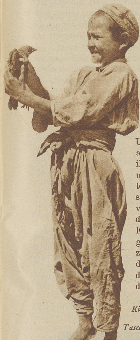
Kirgisen Junge aus der Taschkenter Gegend hatten in einem Harem gefangen