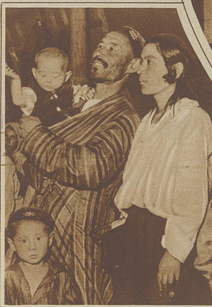
Der Tag der Schleierabnahme in Taschkent. Bildnis eines Unbekannten mit seiner Familie. Er gibt der Versammlung einen Eid ab, daß er seine Frau wegen der Schleierabnahme nicht strafen werde

Schon als Kinder wurden sie von den Eltern gegen eine Kaufsumme einem Manne überliefert, der sie — je nachdem ihm das seine Mittel erlaubten — allein oder mit mehreren Frauen in seinen Harem einschloß. Außer ihm durfte nie ein Mann das Gesicht der Frau erblicken. Der Emir von Buchara besaß noch bis zu seiner Flucht im Sommer 1920,