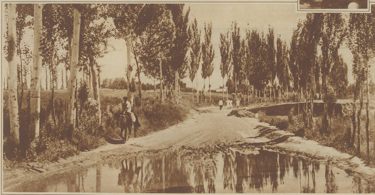
Verkehrswege in Inner-Asien. Straße mit Pappeln in der Nähe von Taschkent