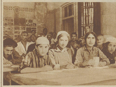
Arbeiter und Arbeiterinnen in einer neugegründeten Seidenfabrik bei Samarkand lernen lesen und schreiben — den Anfang aller Selbstständigkeit