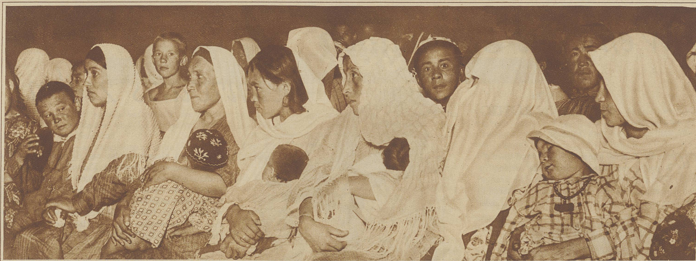
Die Feier der Schleierabnahme in Taschkent, zu der junge Mütter ihre Kinder mitbringen. Die zweitäußerste Frau rechts ist noch nach alter Sitte völlig verhüllt hergekommen. Sie wird nach der Versammlung den Schleier abnehmen.