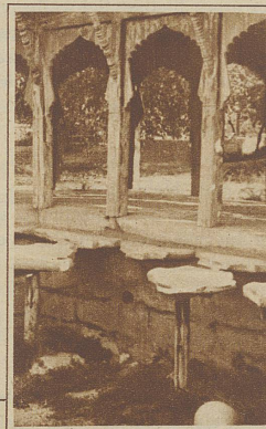
Das ehemalige Haremsbad des Emirs von Buchara