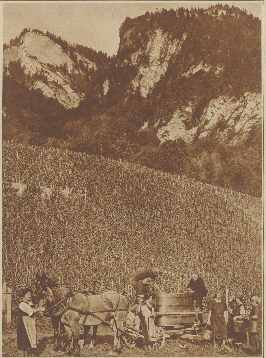
In den Malanser Weinbergen

Der liebste Buhle, den ich han, der liegt beim Wirt im Keller. Er hat ein hölzern Röcklein an Und heißt der Muskateller. Er hat mich nächtens trunken gmacht und fröhlich heut den ganzen Tag. Gott geb ihm eine gute Nacht.