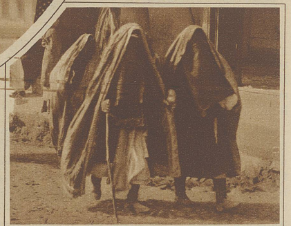
Noch trifft man in den Straßen unheimliche Gestalten mit einem Schleier aus Pferdehaar