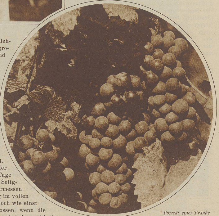
Porträt einer Traube aus dem Weinland

Seht, so ist das brave, bescheidene und herzlich einfache Völklein der schweizerischen Winzer: hoffnungsfreudig, Jahr für Jahr — himmelhoch jauchzend vor Dankbarkeit an das Geschick, wenn es ihm