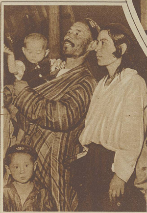
Der Tag der Schleierabnahme in Taschkent. Bildnis eines Unbekannten mit seiner Familie. Er gibt der Versammlung einen Eid ab, daß er seine Frau wegen der Schleierabnahme nicht strafen werde

Schon als Kinder wurden sie von den Eltern gegen eine Kaufsumme einem Manne überliefert, der sie — je nachdem ihm das seine Mittel erlaubten — allein oder mit mehreren Frauen in seinen Harem einschloß. Außer ihm durfte nie ein Mann das Gesicht der Frau erblicken. Der Emir von Buchara besaß noch bis zu seiner Flucht im Sommer 1920,