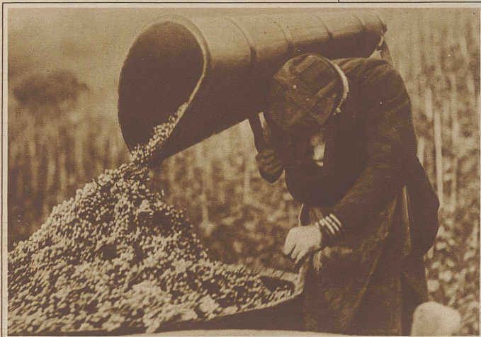
Das «Büki» mit dem köstlichen Inhalt

Doch sachte und gemach! Der Traum wird tiefer. Selig schweift der Blick in dieser glücklichsten frohen Stunde über das gewellte Hügelland und fühlt Gottes Segen in die Trauben vom Himmel tropfen, daß sie süß und schmatzig, herb und berauschend werden.